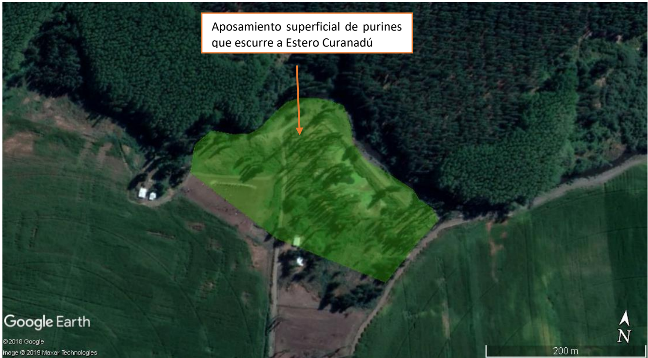
Figura 3. Aposamiento superficial de purines

Sin otro particular, le saluda atentamente,