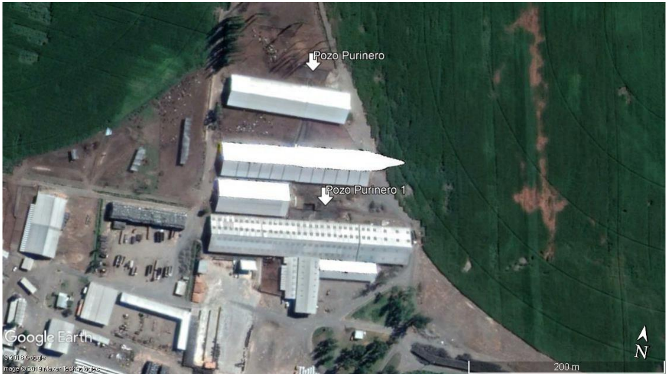
Figura 2. Ubicación de pozos purineros 1 y 2

los purines son llevados al siguiente pozo, desde el cual se extraen a través de una bomba para cargar los camiones (Fotografía 3 y 4). Los pozos se encuentran ubicados en sectores donde no cuentan con techo, entre los galpones correspondientes a los corrales (Figura 2). En la inspección realizada, fue posible observar evidencia de rebalse y escurrimiento de los pozos purineros hacia el suelo colindante y posteriormente al sistema de conducción de aguas lluvias y consecuentemente al estero Curanadú (Fotografías 5 y 6).