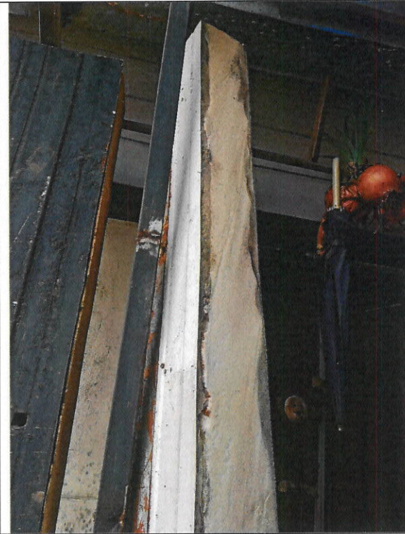
Foto No 5 Placa Aislante pendiente de instalación Muro perimetral oriente de 14 cm de espesor.