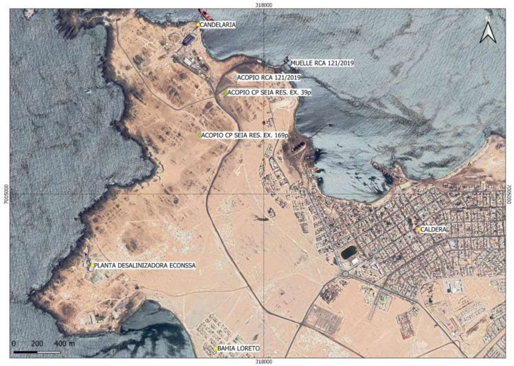
Figura 1. Mapa de ubicación local (Fuente: Elaboración Propia).