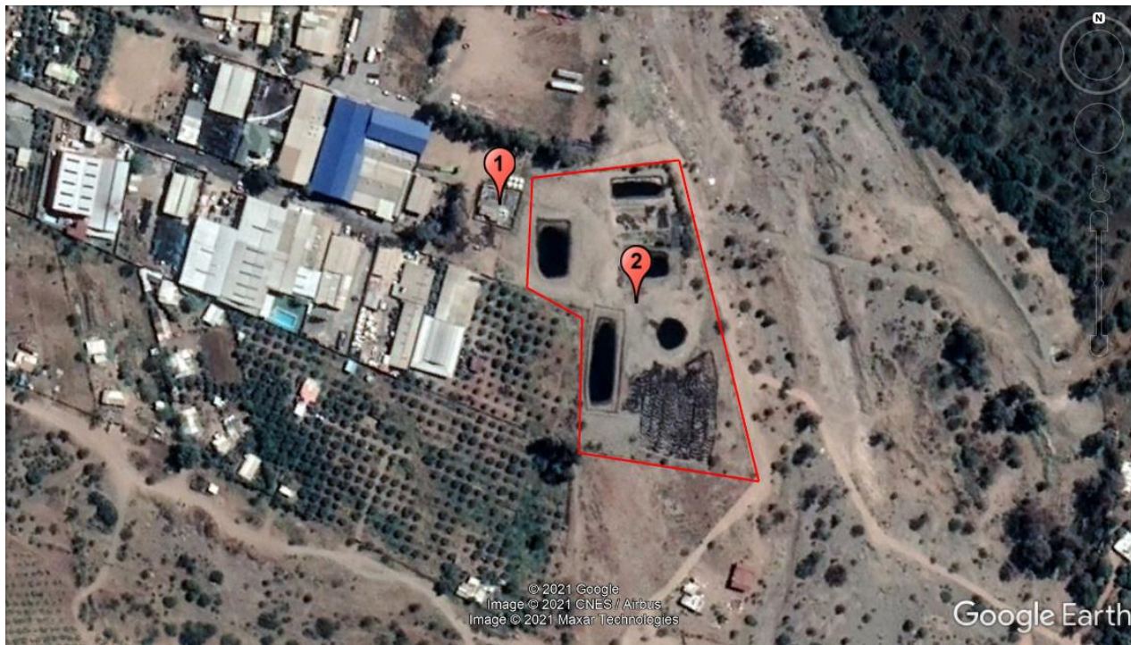
Figura 3. Esquema del Recorrido. En rojo se muestran las estaciones visitadas, 1 y 2.