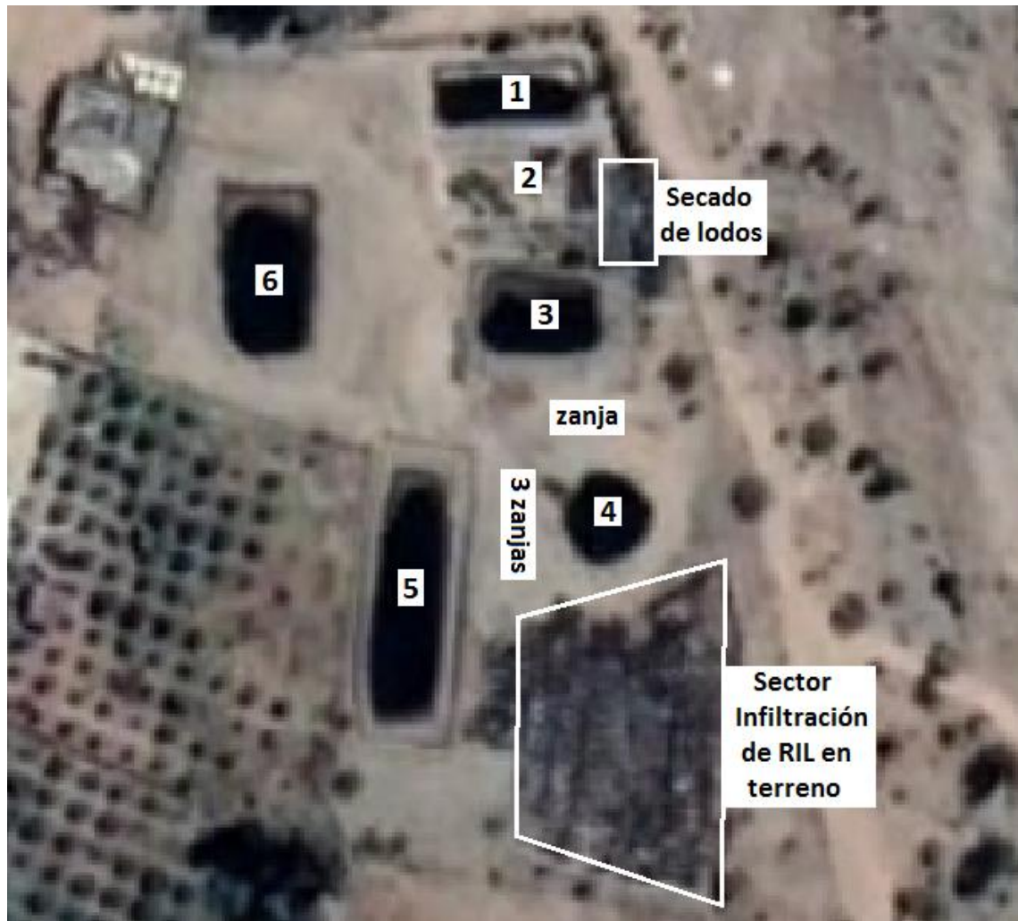
Figura 2. Zona de disposición final. Piscinas de acumulación enumeradas, zona donde se ubican las zanjas, sector de secado de lodos y sector de infiltración de RIL en terreno (Fuente: Google Earth 2021, fechas de imágenes: 10/06/2020).