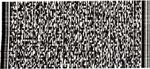
Timbre Electrónico SII

Referencias: - Orden Compra N° 4500551294 del 2021-02-05 - Nota Pedido N° 1870 del 2021-02-05