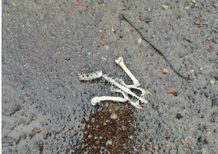
Fotografía N°1: restos óseos de fauna actual