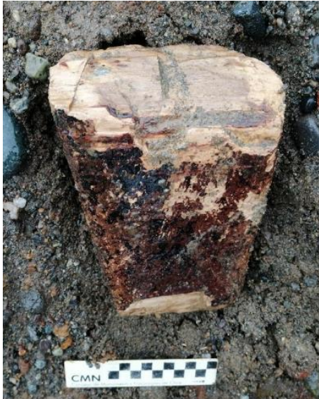
Fotografías N°2 y 3: Hallazgos paleontológicos N°1 y 2