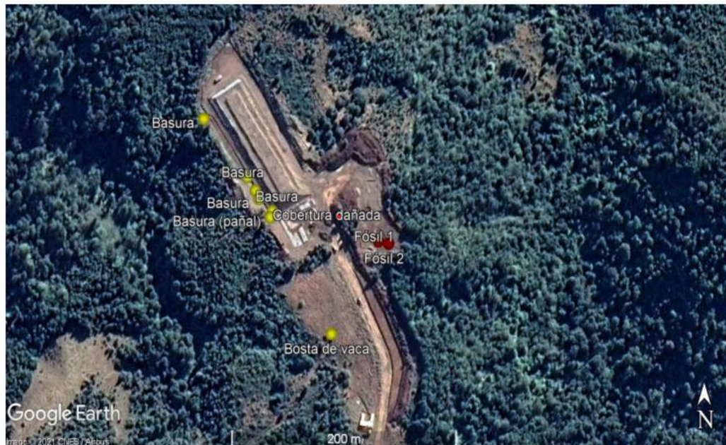
Imagen satelital N°1: Hallazgo paleontológico al interior del proyecto

“Se accede a relleno sanitario por camino vehicular, al ingresar al predio se observa un vacuno. A continuación, se presenta mapa general con hallazgos paleontológicos (ver Imagen Satelital N°1).