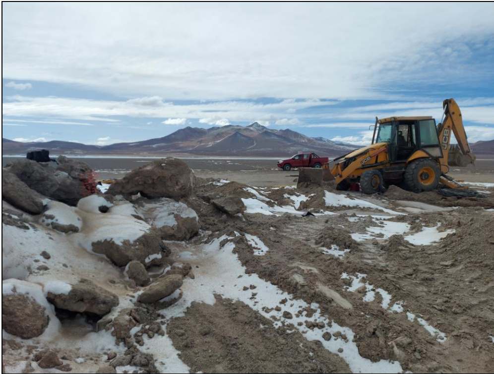
Figura 5. Restos de materiales extraídos tras la intervención de lugar.