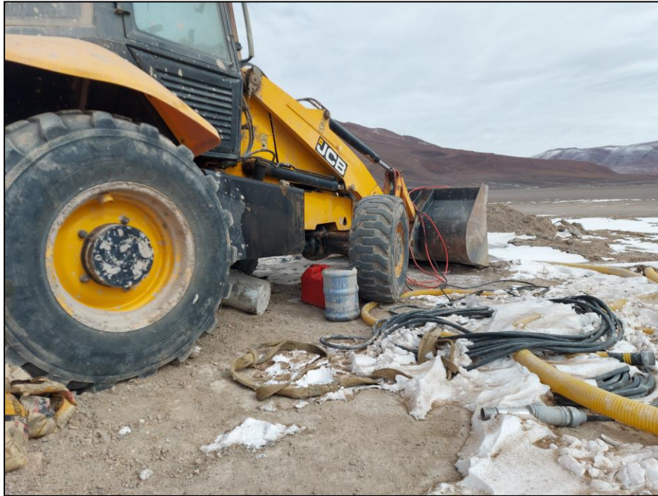
Figura 8. Cableados de perforación, mangueras, restos de bidones de agua y un bidón de combustible.