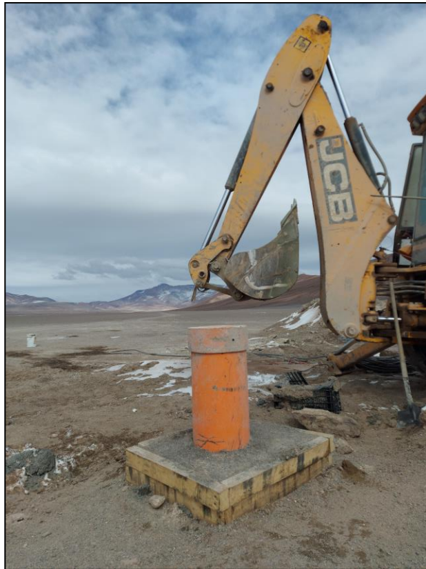
Figura 4: Estructura construida en lugar de perforación.