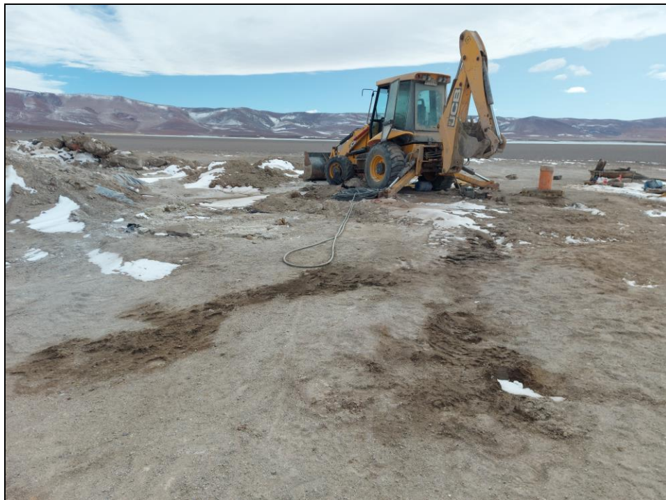
Figura 2. Retroexcavadora y restos de material de la faena que realizan. Las manchas oscuras en el sustrato parecerían ser filtraciones de aceites.

A continuación se presentan registros fotográficos de lo encontrado en el lugar: