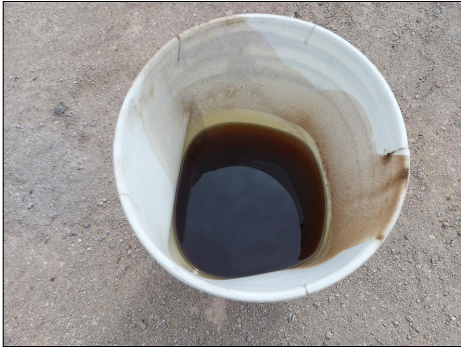
Figura 3. Galón de aceite de 20 Lt aún con aceite, sin tapa ni protección expuesto al ambiente.