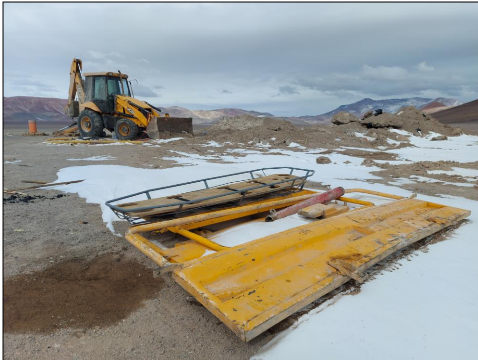
Figura 6. Restos de camiones, restos de carbón, camilla de emergencia y mancha aparentemente de aceite en el sustrato.