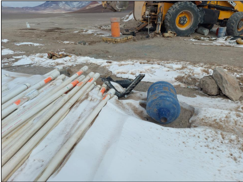
Figura 7. Tubos, bidón de plástico y basura.