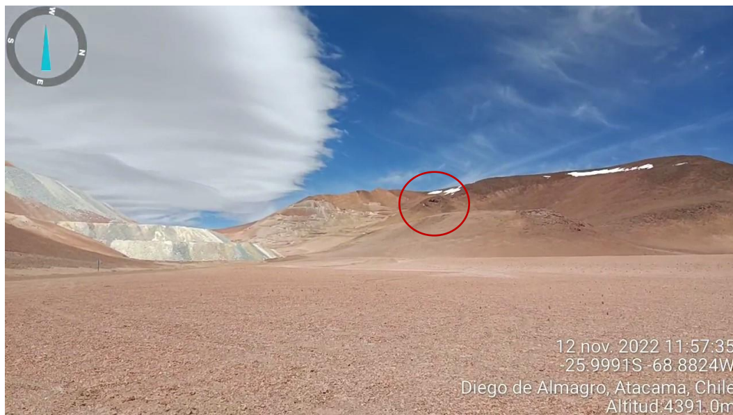
Imagen 2. Vista general Roquerío 8.