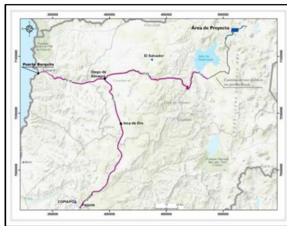
Figura 1. Ubicación general del Proyecto.