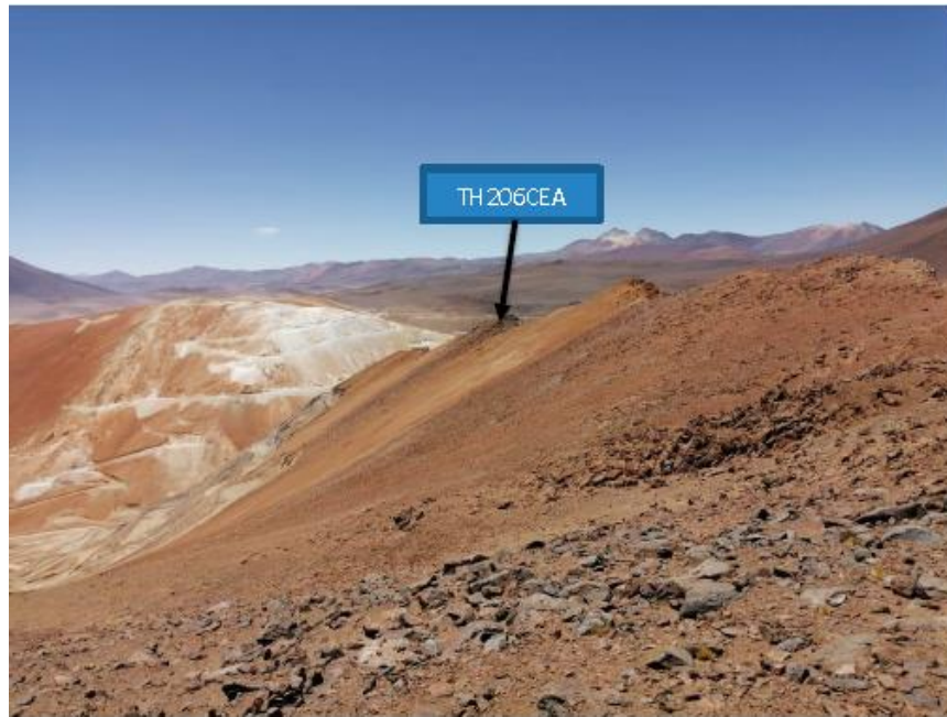
Imagen 1. Vista Roquerío 5.