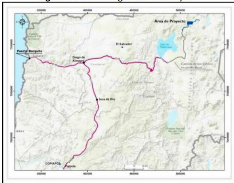
Figura 1. Ubicación general del Proyecto