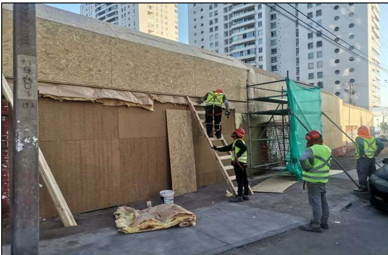
Cierre acústico ejecutado por Calle Sagasca

Con relación a ejecución de cierre acústico, a continuación, se muestran imágenes del avance y desarrollo de esta partida.