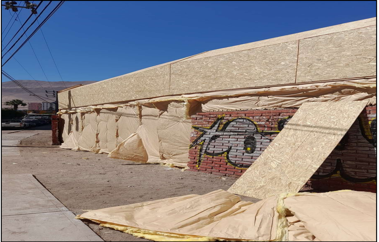
Termino instalación lana mineral cierre acústico por calle Sagasca