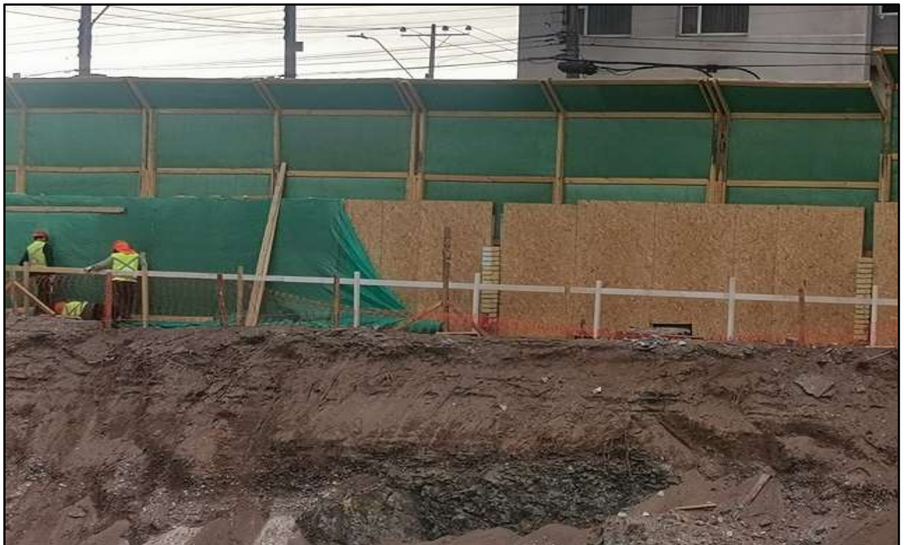
Instalación de planchas de OSB 15 mm por el interior de la obra, calle Sagasca