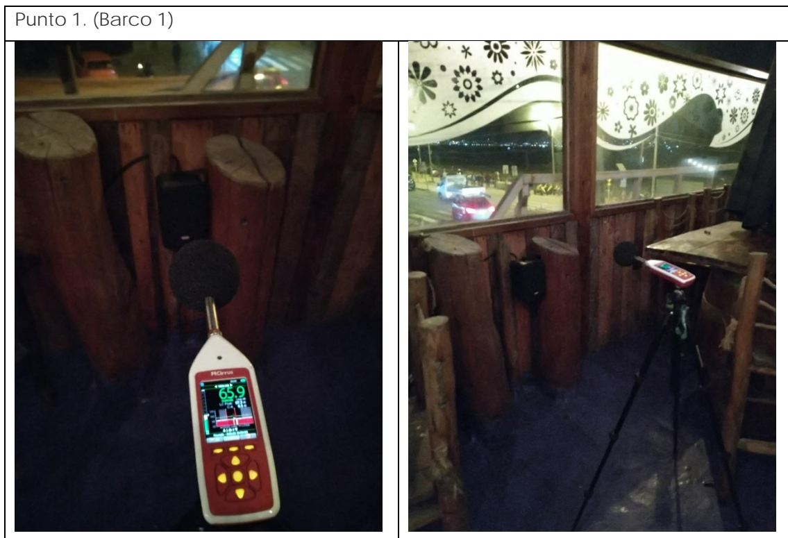
Ilustración 3. Punto de medición 1 (Barco 1), segunda planta. Restaurante Huentelauquén.

La ubicación del equipo de medición se muestra en las ilustraciones siguientes: