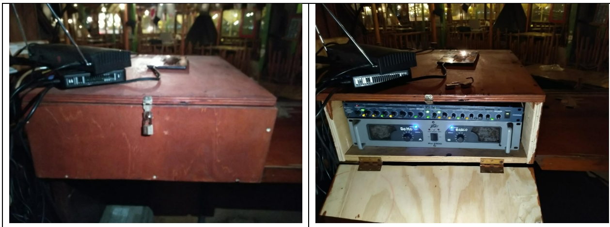
Ilustración 1. Ubicación del limitador y amplificador en la caseta de Audio, segunda planta del restaurante.

Tanto el amplificador como el limitador se encuentran en la caseta de Audio de la segunda planta, en una caja cerrada. La ubicación se muestra en la Ilustración 1. El sistema cuenta además con una mesa de Audio ubicada en la misma caseta.