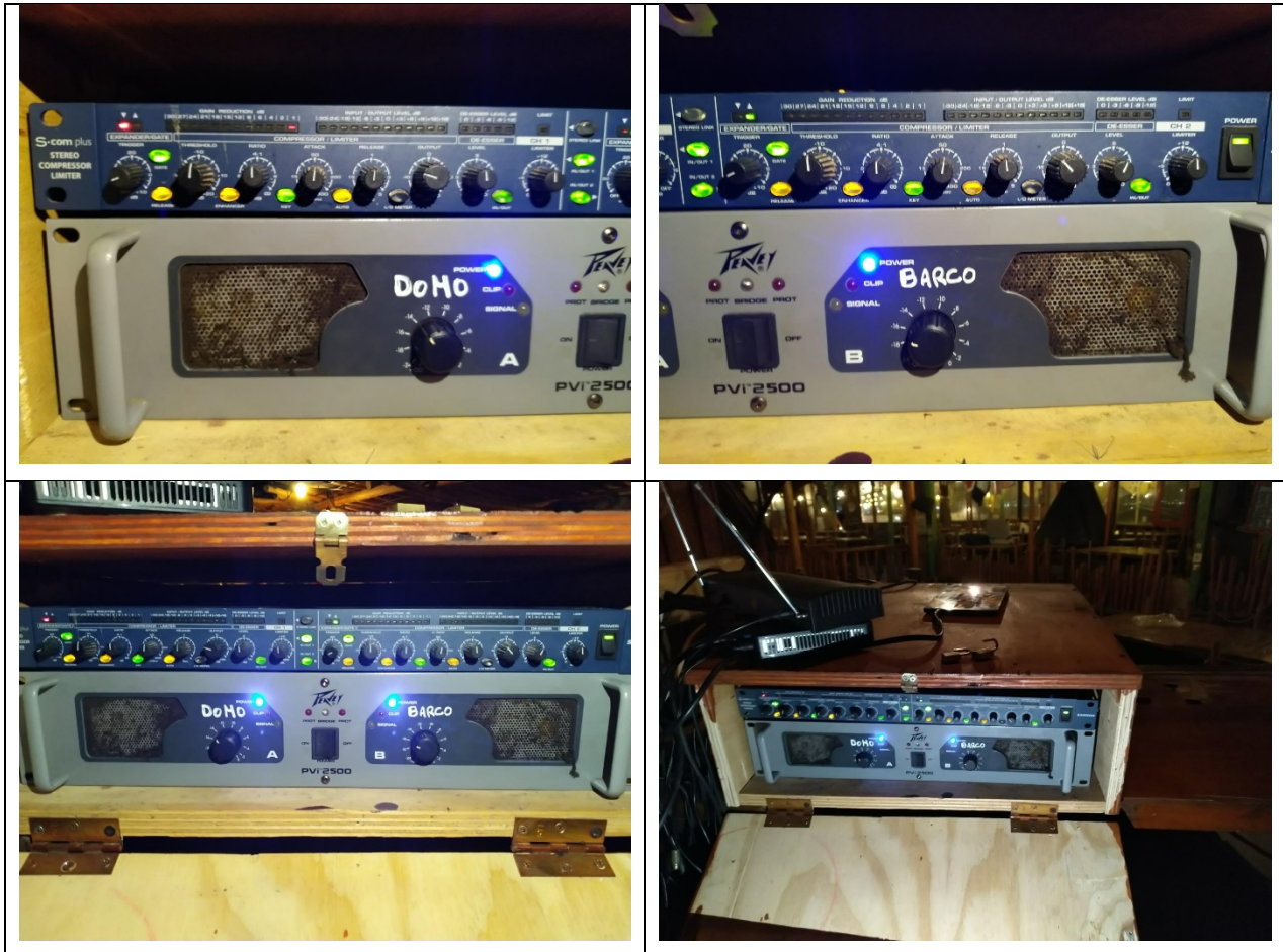
Ilustración 2. Configuración del amplificador y limitador, Sistema de Audio de la segunda planta del local.

Se ha realizado una verificación del funcionamiento de los niveles de ruido producidos por el sistema de Audio con el limitador. La configuración se muestra en la Ilustración 2.