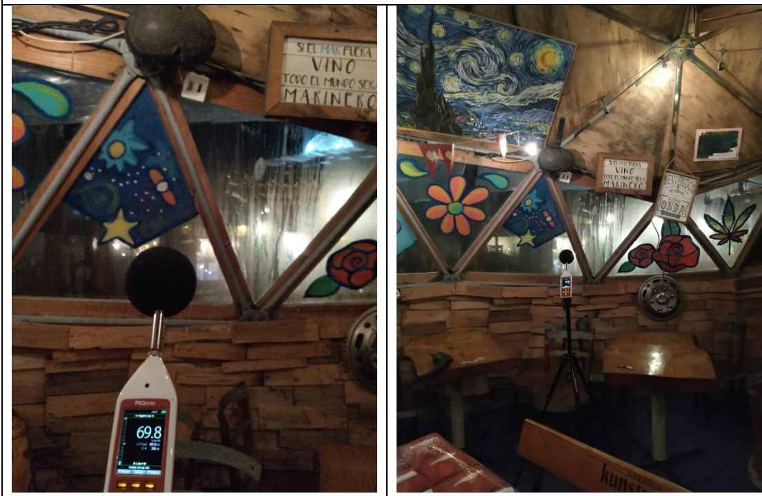
Ilustración 6. Punto de medición 4 (domo – interior), segunda planta. Restaurante Huentelauquén.