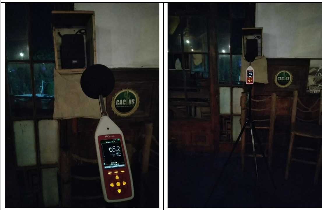
Ilustración 7. Punto de medición 5 (domo - sala 2), segunda planta. Restaurante Huentelauquén.