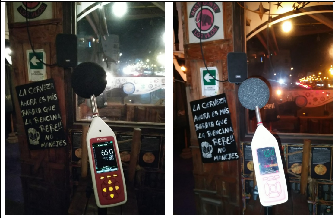
Ilustración 8. Punto de medición 6 (domo - sala 3), segunda planta. Restaurante Huentelauquén.