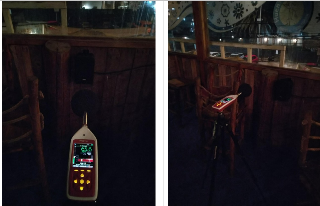
Ilustración 4. Punto de medición 2 (Barco 2), segunda planta. Restaurante Huentelauquén.