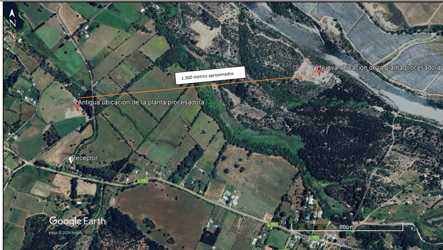
Figura 1

Descripción del medio de prueba: Se observa en la figura la antigua ubicación de la planta procesadora de áridos y su nueva ubicación en las cercanías del río Longaví, desplazándose unos 1.300 metros aproximadamente.