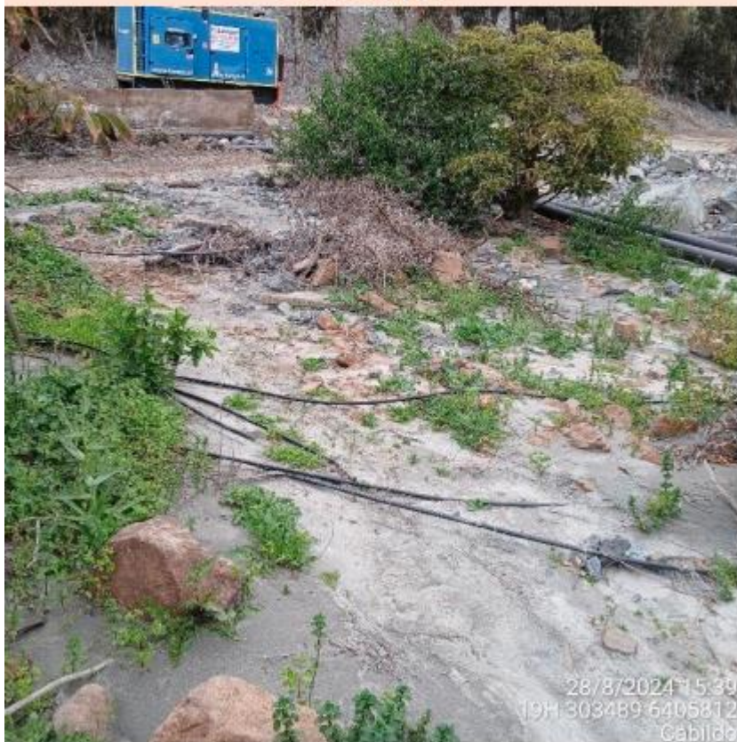
Imagen N° 31a. Área afectada sector Quebrada Los Maquis.