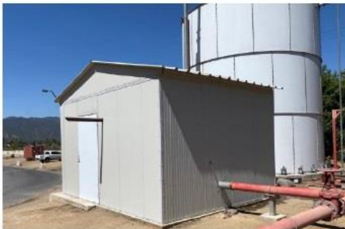
Fotografía 4.

Descripción del medio de prueba: vista de la bomba de incendio encerrada con el objeto de mitigar la emisión de ruidos.