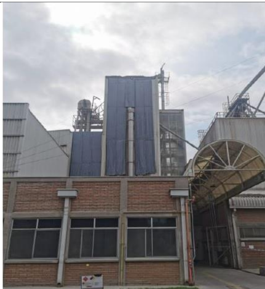
Fotografía 2. (Fuente: Agrícola Súper Ltda. carta del 23 de marzo 2023 [Anexo 7])

Descripción del medio de prueba: Vista frontal de la planta y en verde la sugerencia indicada en el estudio acústico respecto a la instalación de barreras acústicas.