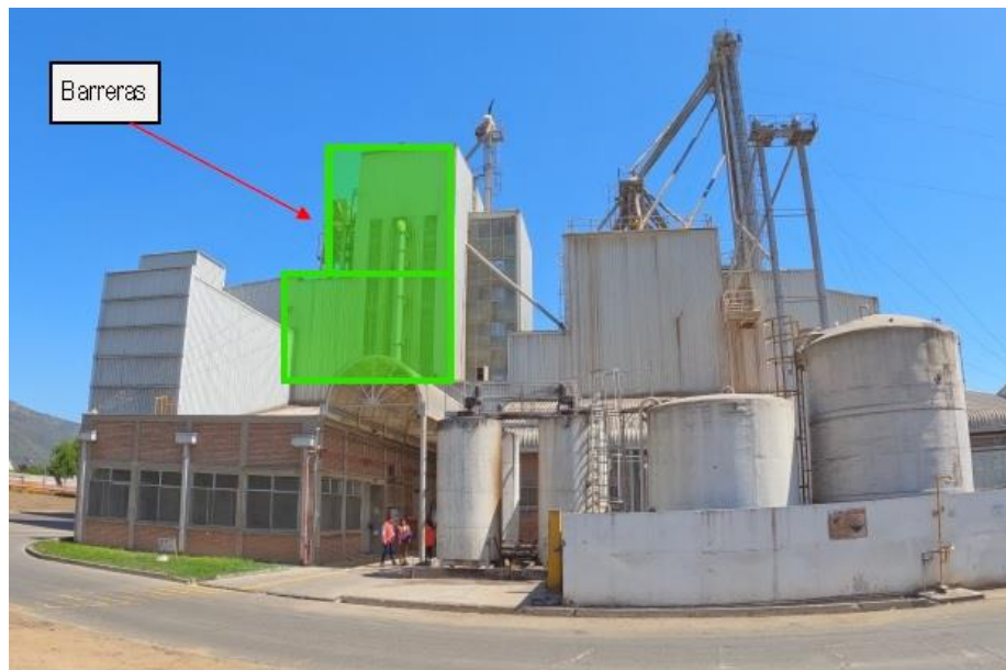
Fotografía 1.

Descripción del medio de prueba: Vista frontal de la planta y en verde la sugerencia indicada en el estudio acústico respecto a la instalación de barreras acústicas.