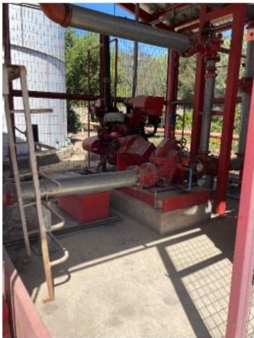
Fotografía 3.

Descripción del medio de prueba: Vista de la bomba de incendio la cual se encontraba sin revestimiento y es una fuente emisora que se indicó que debe ser cubierta para mitigar el ruido