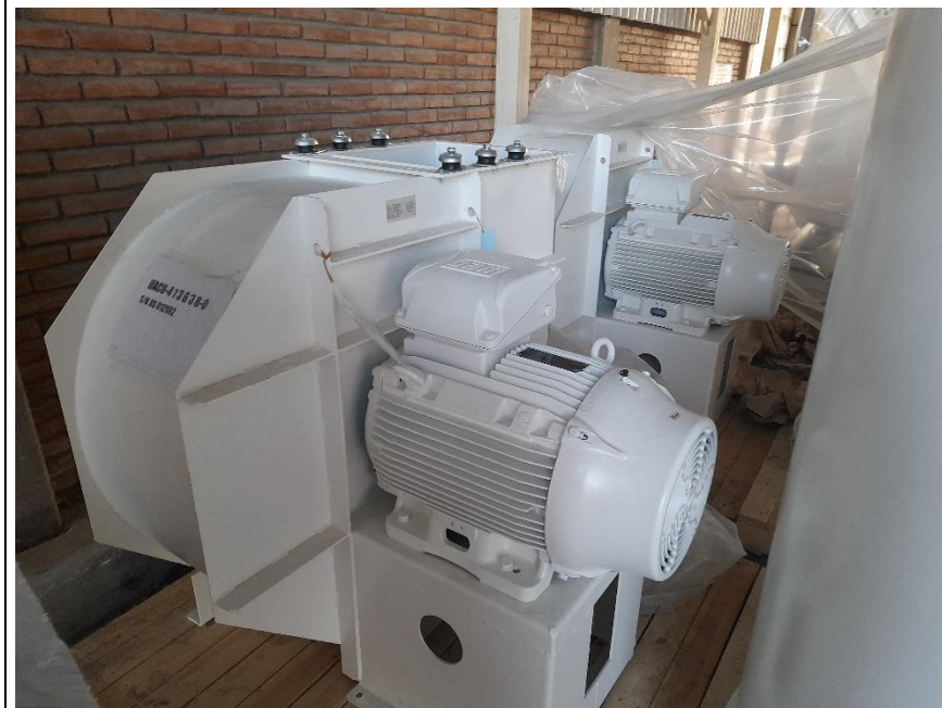
Fotografía 6.

Descripción del medio de prueba: Vista del sensor de atoché instalado en el ciclón.