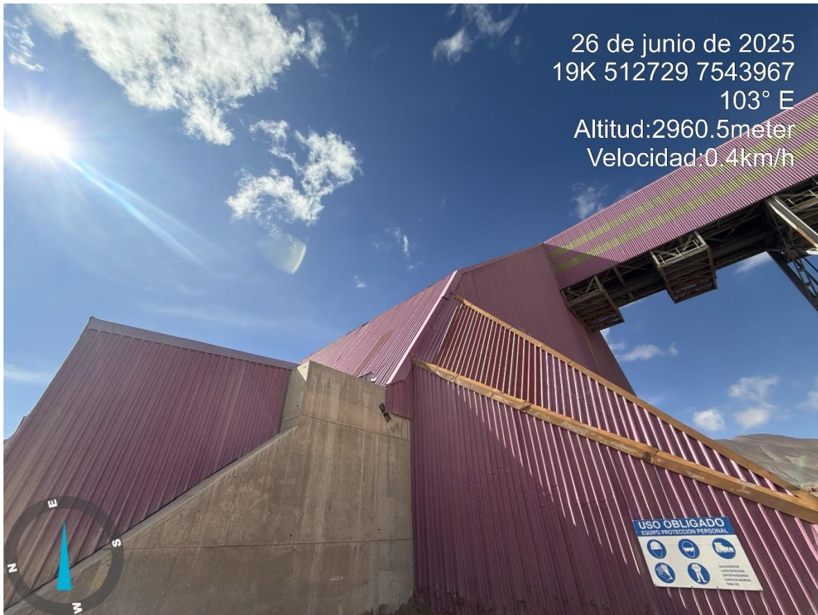
Imagen n°7 Pared Sur Stock Pile Grueso , vista sur sector llegada correa CV.