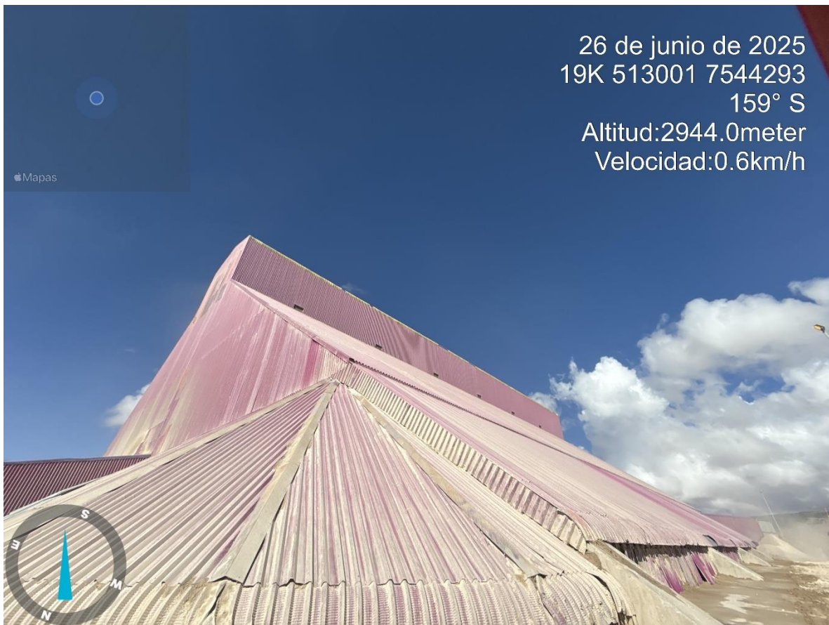
Imagen n°13 Pared Norte Stock Pile Fino avance del mejoramiento del revestimiento.