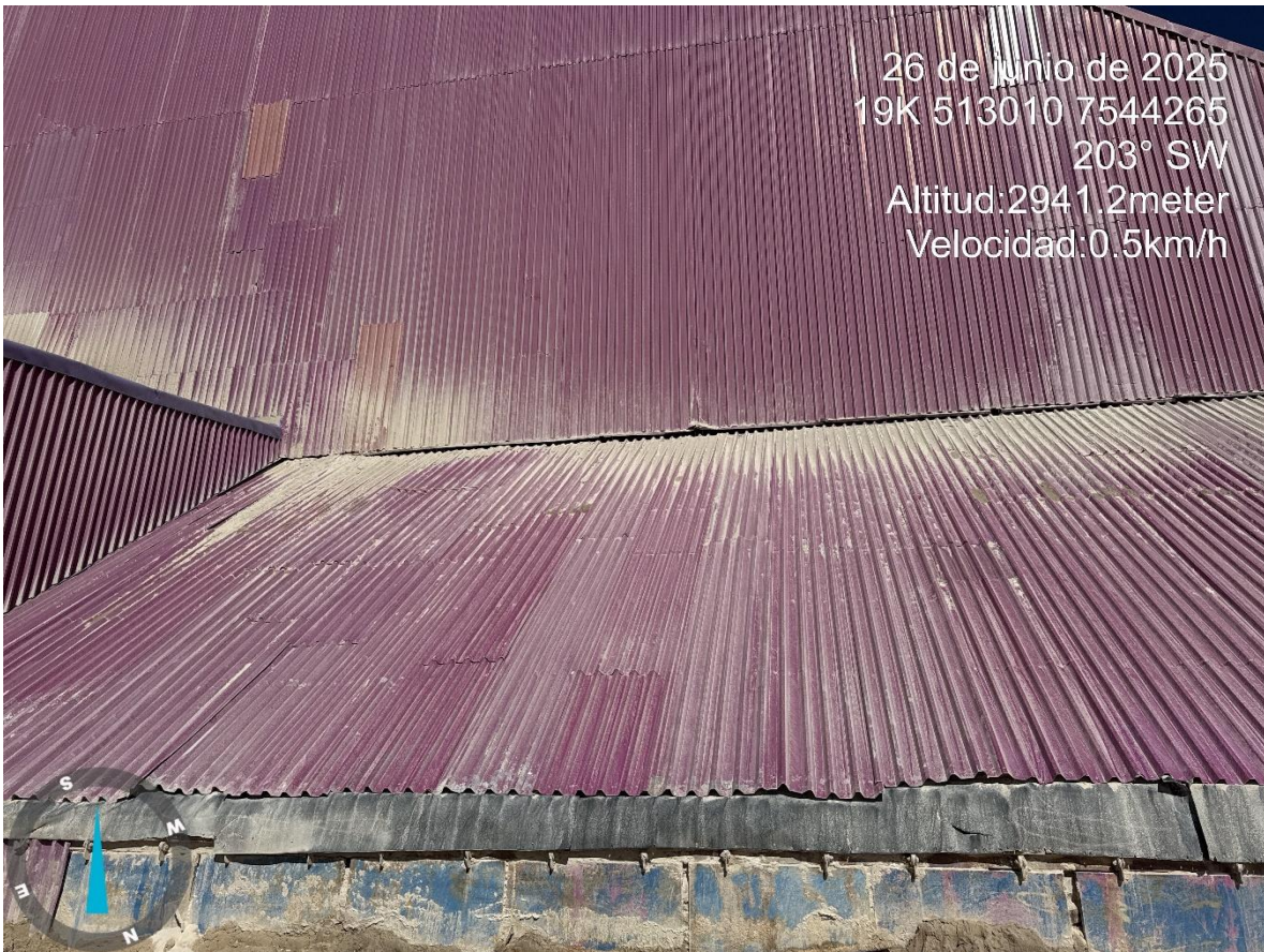
Imagen n°12 Pared Sur Stock Pile Fino , reparación base este de Stock, cambio de compuertas.