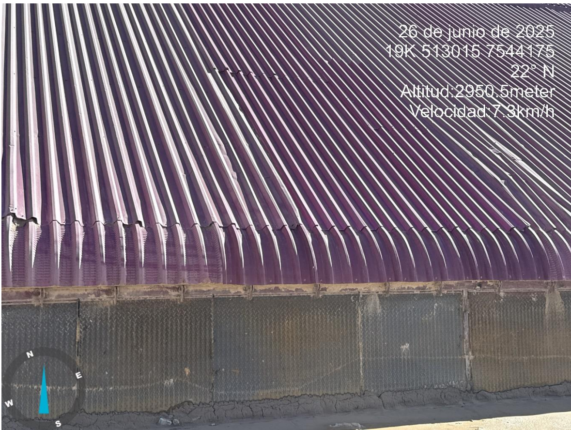
Imagen n°10 Pared Este Stock Pile Grueso, reparación base este de Stock, cambio de compuertas.