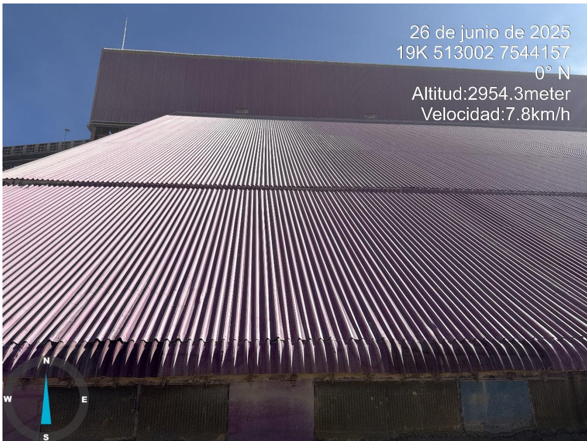
Imagen n°9 Pared Este Stock Pile Grueso, reparación base este de Stock, cambio de compuertas.