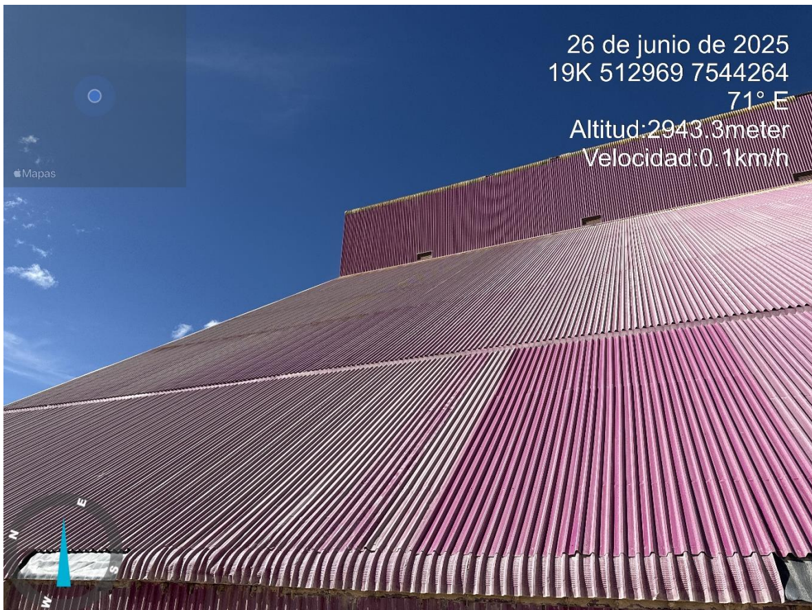
Imagen n°15 Pared Oeste Stock Pile Fino avance del mejoramiento del revestimiento ladera oeste.

c) Ordenes o contrato de trabajo y bitácoras entre otros.