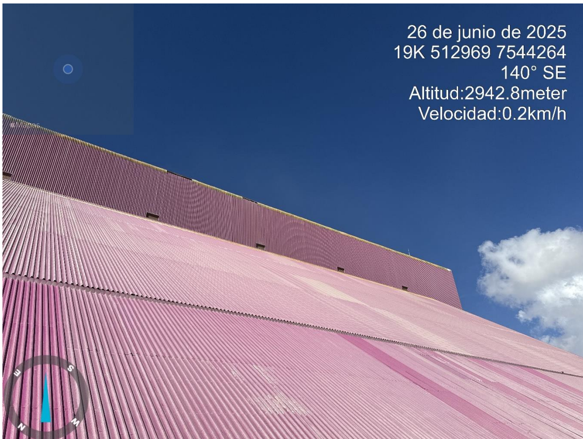
Imagen n°14 Pared Oeste Stock Pile Fino avance del mejoramiento del revestimiento ladera oeste.