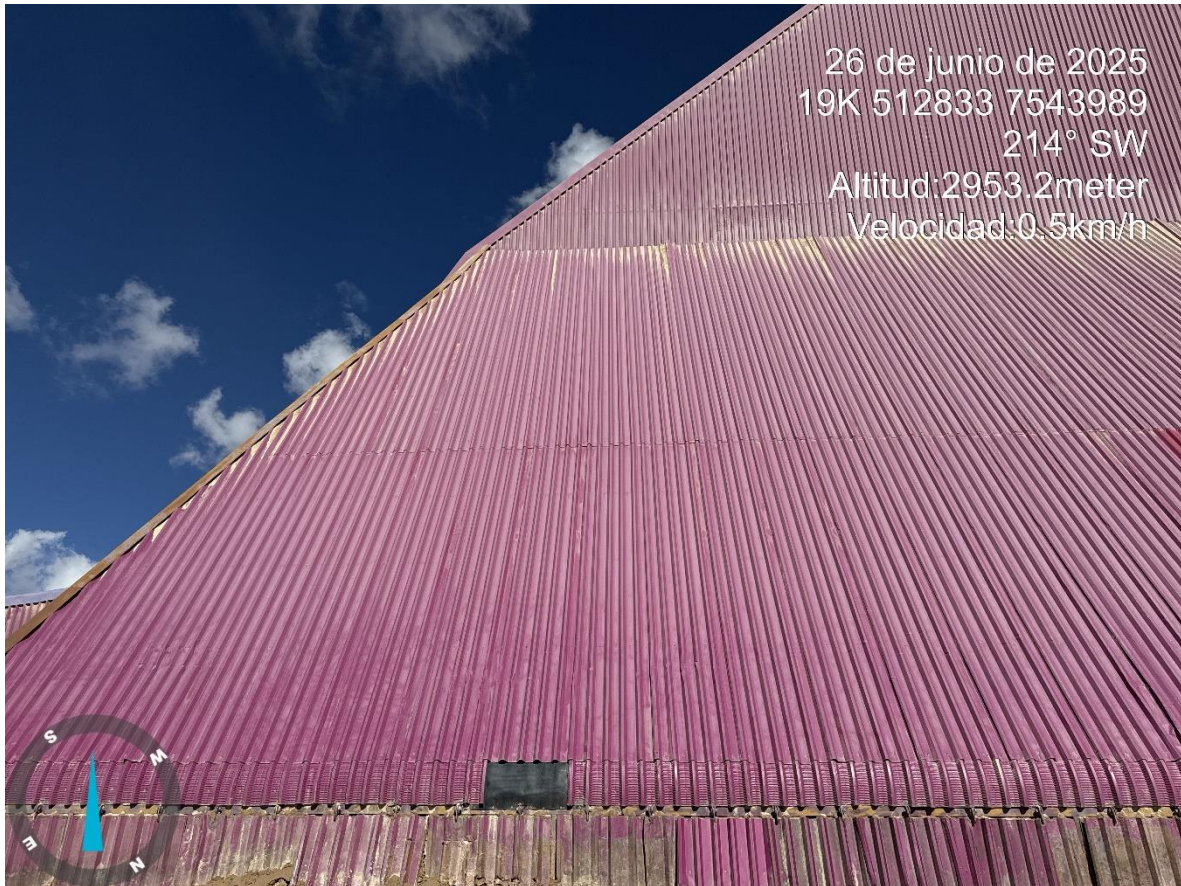
Imagen n°1 Pared Noreste Stock Pile Grueso , cambio de calamina.