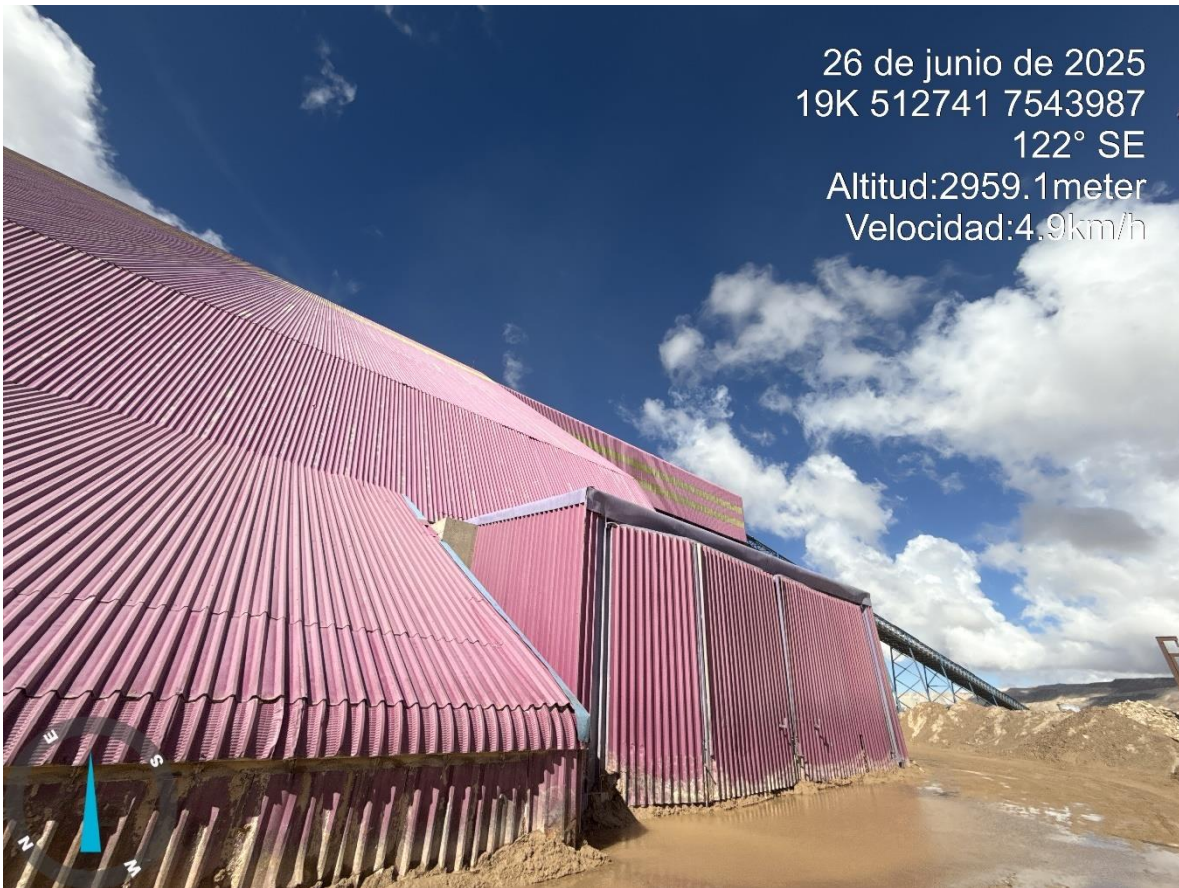
Imagen n°5 Pared Suroeste Stock Pile Grueso , reparación sector portón.