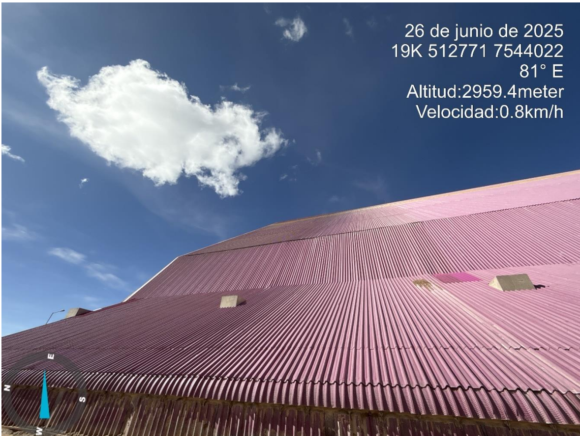
Imagen n°4 Pared Oeste Stock Pile Grueso, cambio de calaminas en ladera del stock.