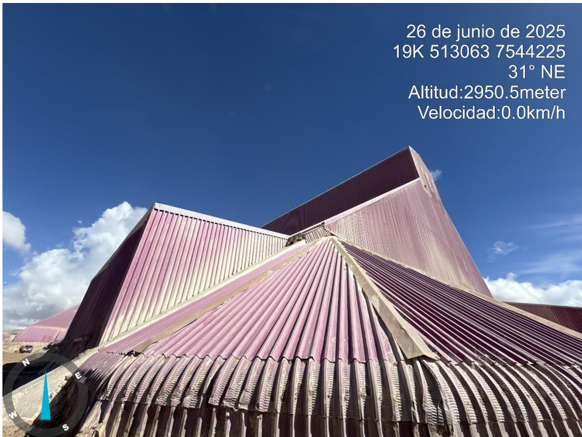
Imagen n°11 Pared Sur Stock Pile Fino vista norte - sur, avance del mejoramiento del revestimiento.