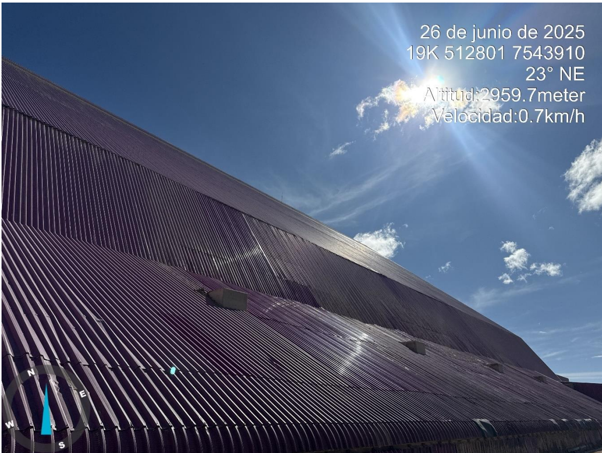
Imagen n°8 Pared Este Stock Pile Grueso, reparación ladera este de Stock.