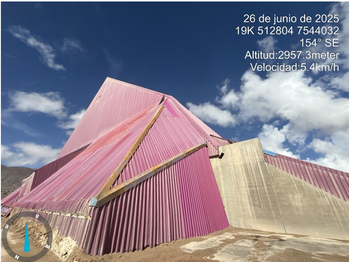
Imagen n°2 Pared Norte Stock Pile Grueso , cambio de calaminas en sector superior.