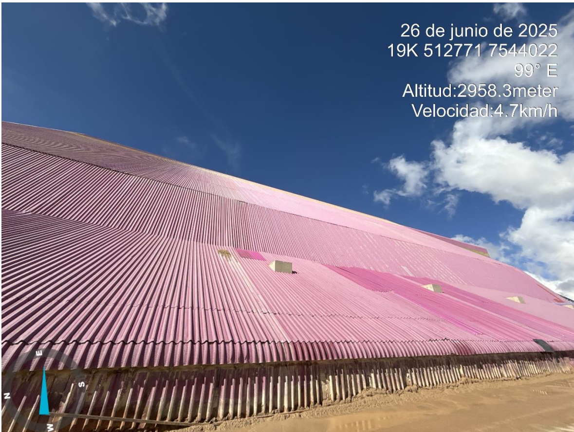
Imagen n°3 Pared Oeste Stock Pile Grueso , mejoramiento del revestimiento en ladera del stock.