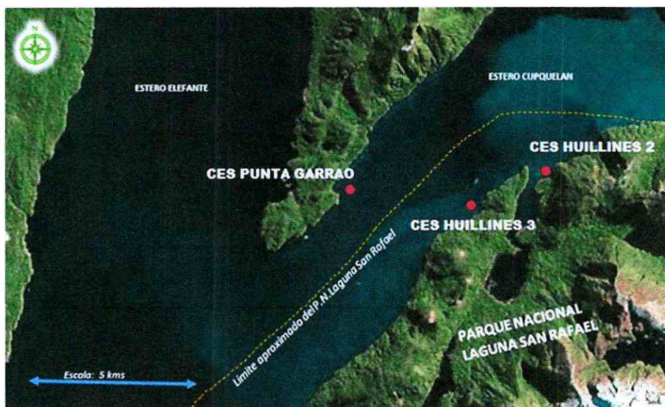
Imagen N° 1: Ubicación del proyecto.