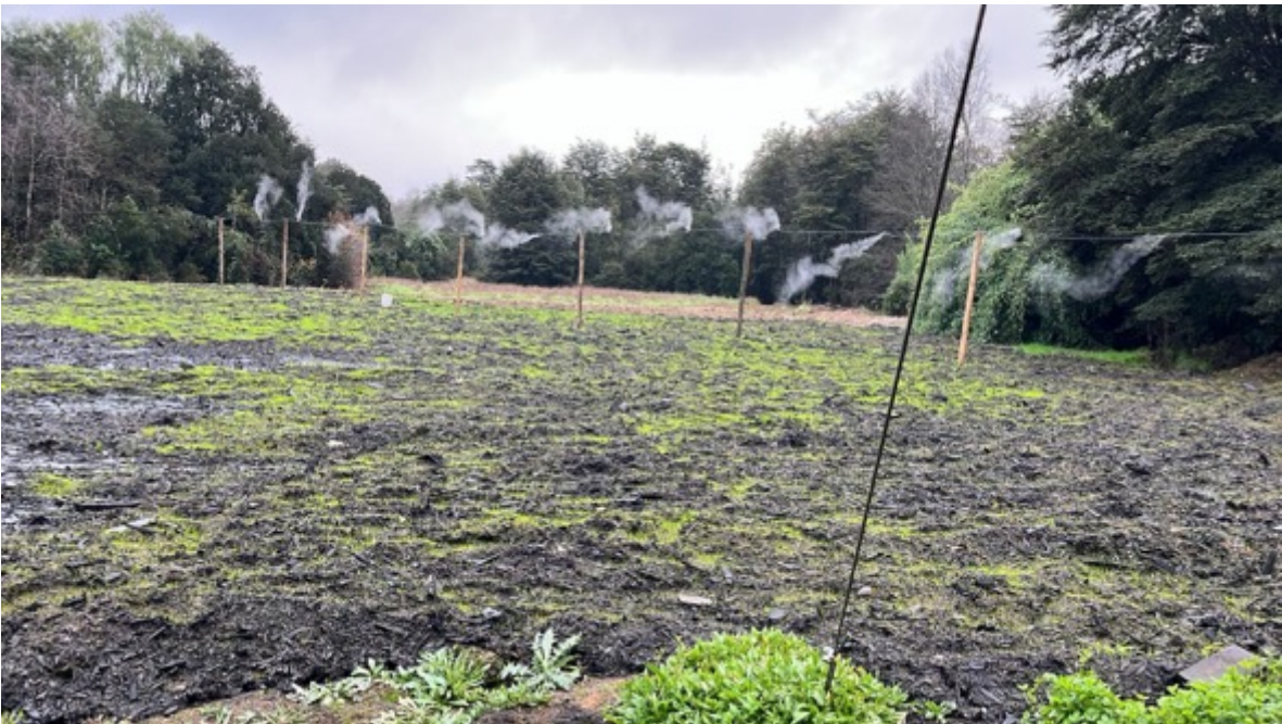
Fotografia 1: Restauración zona de acumulación de Compost

ningún tipo de riesgo de escorrentia de material hacia cuerpos de agua, como este material se a voletado un sin numero de veces (llevamos más de 80 días con excavadoras moviendo el material), este a pasado a estar estable, admás se continúan y continuaran con las medidas de control de olores implementadas durante el mes de abril operando hasta que sea restituida en su totalidad el área de acopio fuera de la RCA.