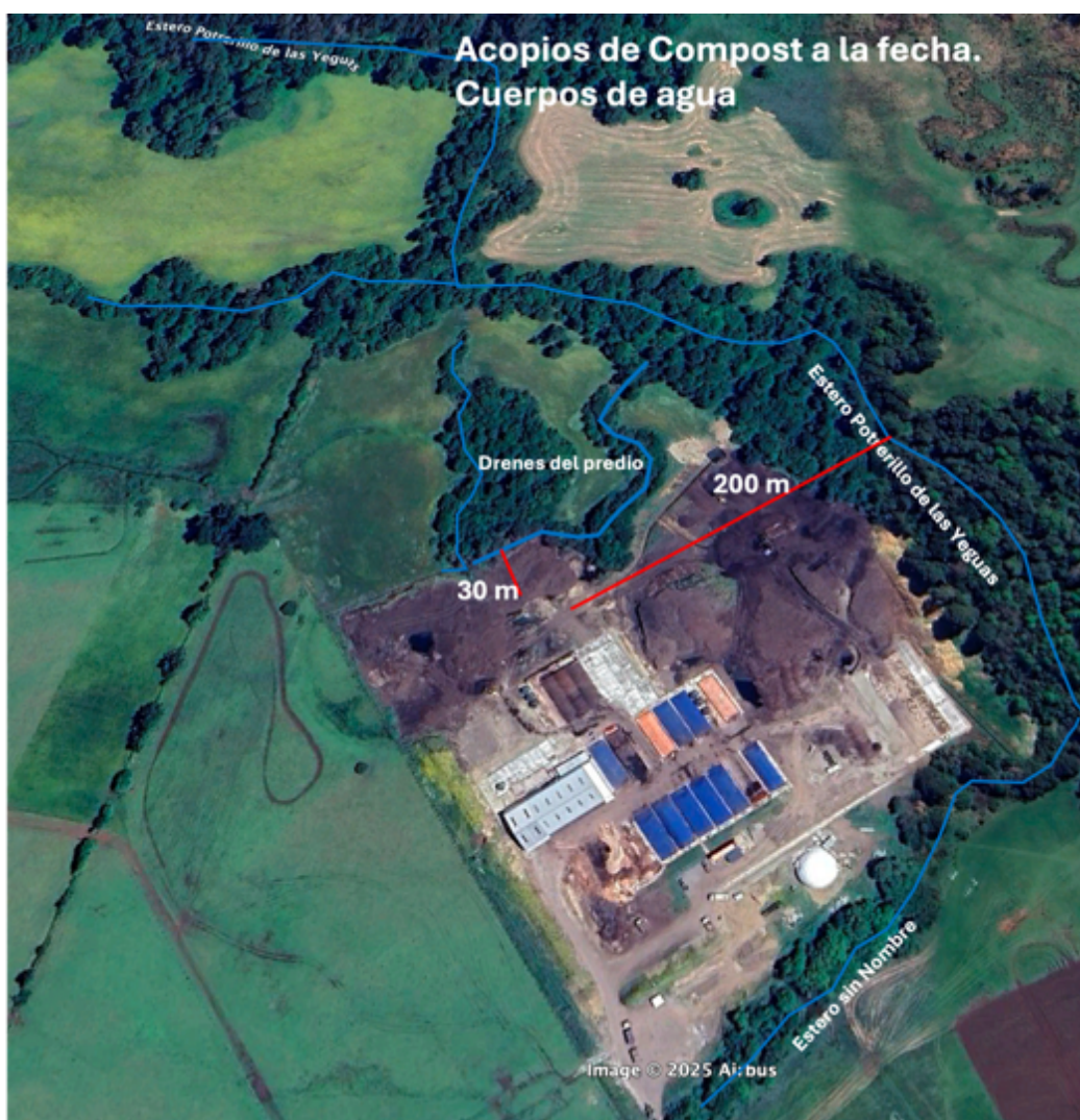
Figura 2: Distancia a cuerpos de agua

La pluviometría de los meses de mayo y junio han sido como siempre en la región de Los Lagos y en la zona de Purranque muy alta, permitiendo el ingreso a campos y a la zona de acopio, sin dificultad hasta los primeros días de mayo (esto se puede ver claramente en como ha disminuido paulatinamente la salida de compost de la planta hacia los agricultores), en estos momentos y luego de los frentes que han causado problema en la zona sur del país se hace imposible la extracción del material, por lo que se a trabajado durante estos ultimas semanas en moverlo a un área con RCA y alejando de los cuerpos de agua. Hoy esa gestión a permitido desafectar más de 10.000 m 2 .