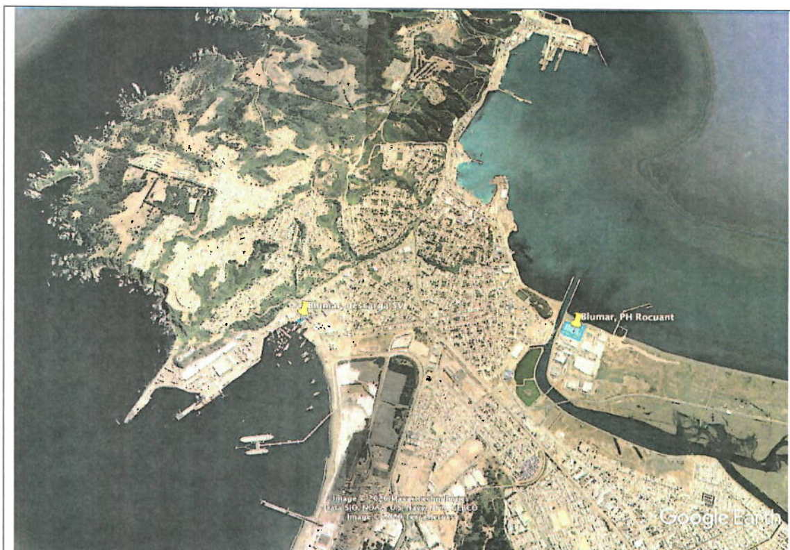
Figura 1. Emplazamiento Proyectos calificados por RCA 302/2006

Descripción: Imagen del Google earth de establecimientos de Blumar S.A.