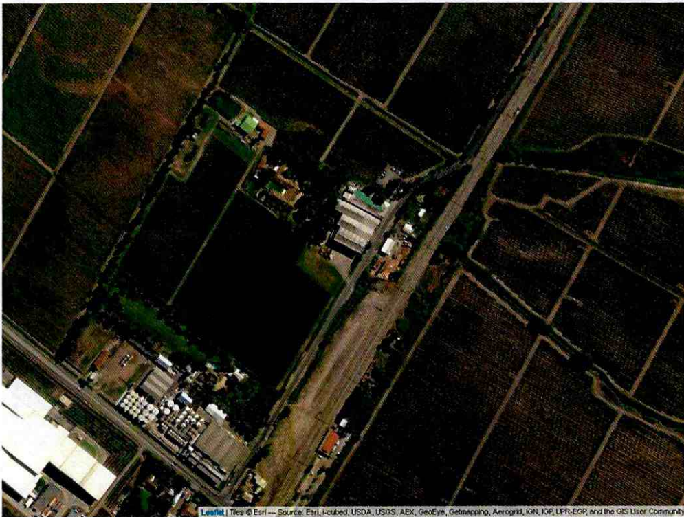
Leaflet | Tiles © Esri — Source: Esri, DeLorme, USDA, USGS, AEX, GeoEye, Getmapping, Aerogrid, IGN, IGP, UPR-EGP, and the GIS User Community

TENGA PRESENTE: Mediante la revisión periódica de sus reportes, y los sistemas de fiscalización remota y en terreno, la Superintendencia del Medio Ambiente observa y analiza de forma permanente su desempeño ambiental.