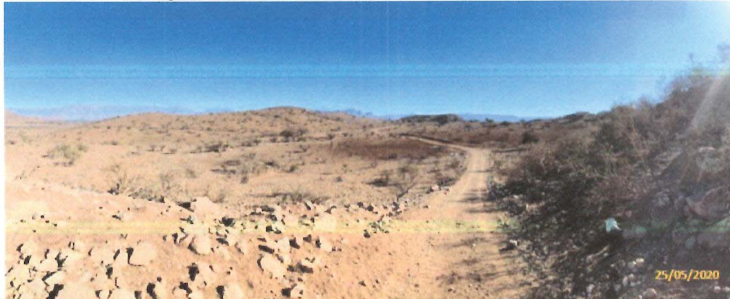
Fotografía 4. Área destinada a emplazamiento de acopio de escarpe