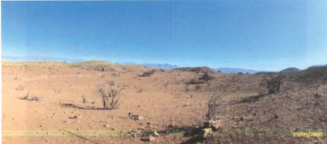
Fotografía 3. Área destinada a emplazamiento de planta de Chancado