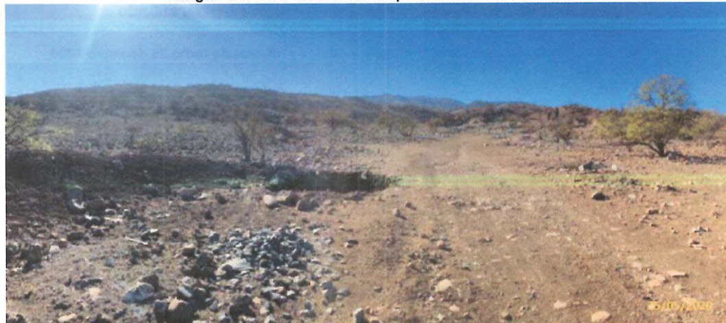
Fotografía 5. Área destinada a emplazamiento de la cantera