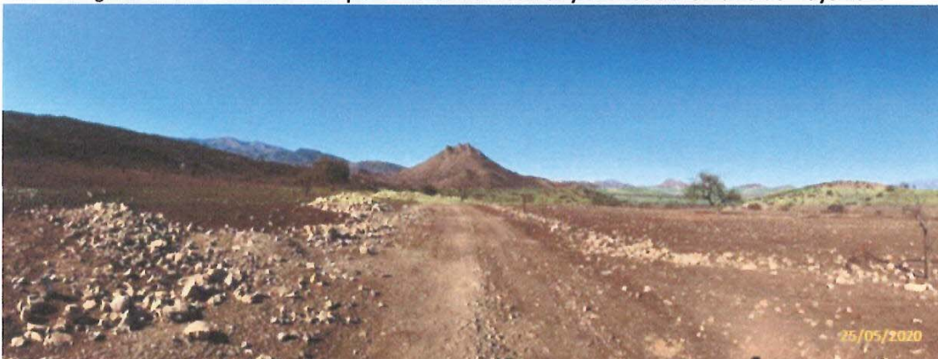
Fotografía 2. Área destinada a emplazamiento de módulos y oficinas de fecha 25 de mayo 2020