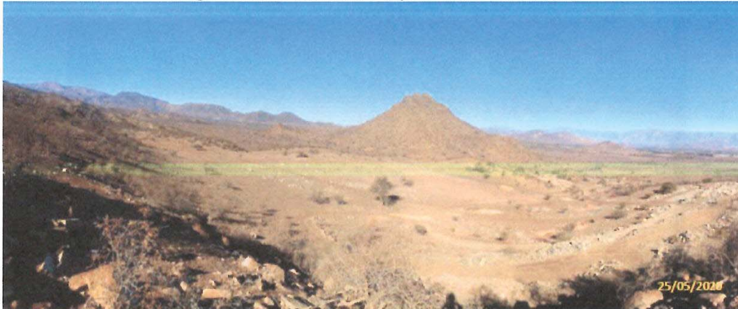
Fotografía 6. Área destinada a emplazamiento de la cantera