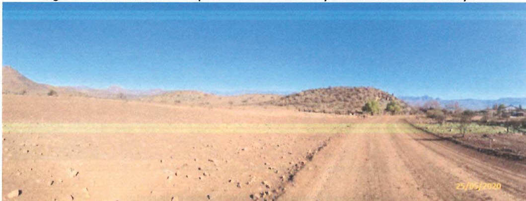
Fotografía 1. Área destinada a emplazamiento de módulos y oficinas de fecha 25 de mayo 2020