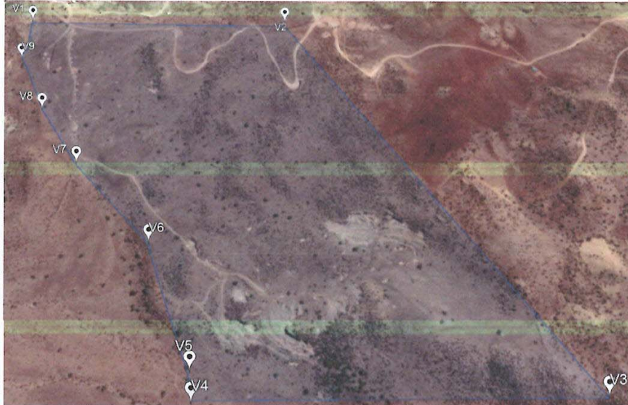
Figura 2. Vista del área de ubicación del Proyecto al 25 de enero de 2020

Fuente: Figura 5 IFA DFZ-2020-2530-XIII-RCA