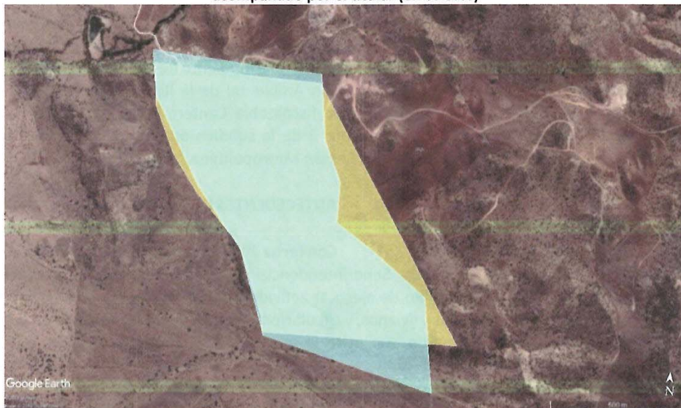
Figura 1. Área de ejecución del Proyecto (en amarillo) y área donde se desarrollará conforme a plano acompañado por el titular (en celeste)