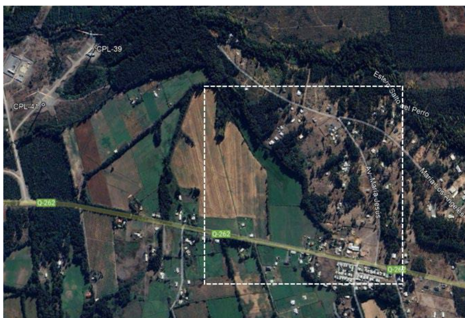
Figura 3. Área de evaluación efecto sombra, sector Av. María Jesús 34, Los Ángeles.