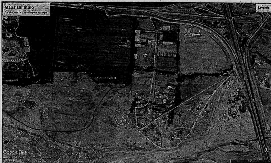
Figura N°1 Ubicación del Proyecto “Escombrera Green World” Región de O’Higgins.