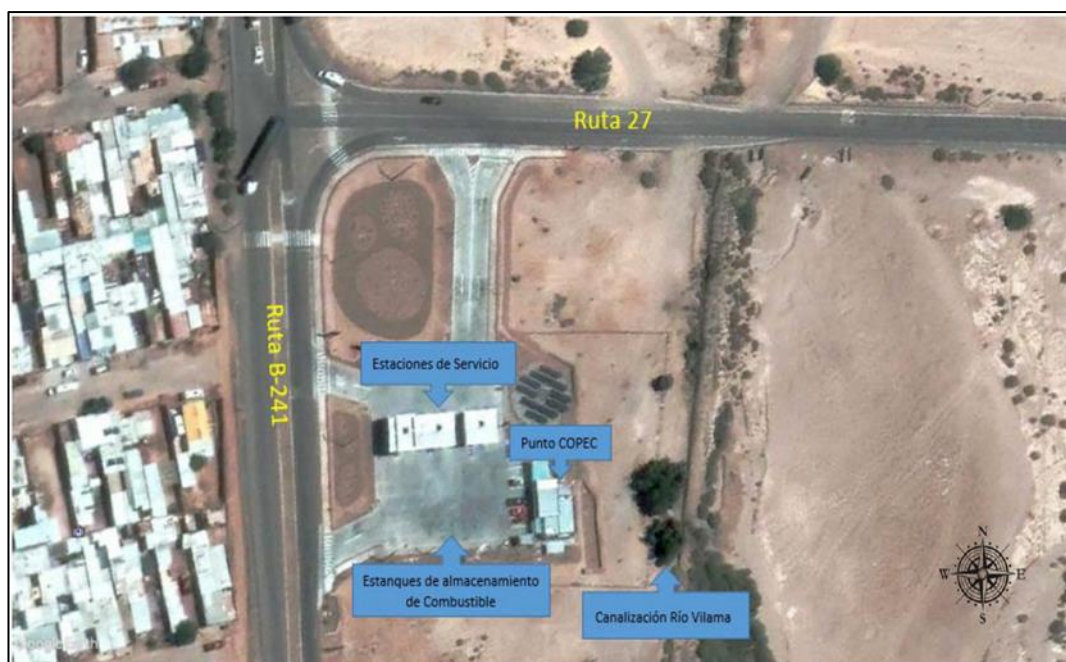
Fuente: Figura N°2 del Informe de Fiscalización Ambiental DFZ-2020-432-II-SRCA