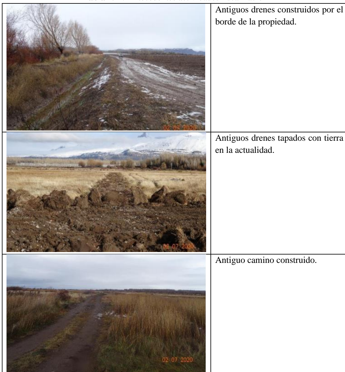
Tabla N°1: Antecedentes actividades fiscalización