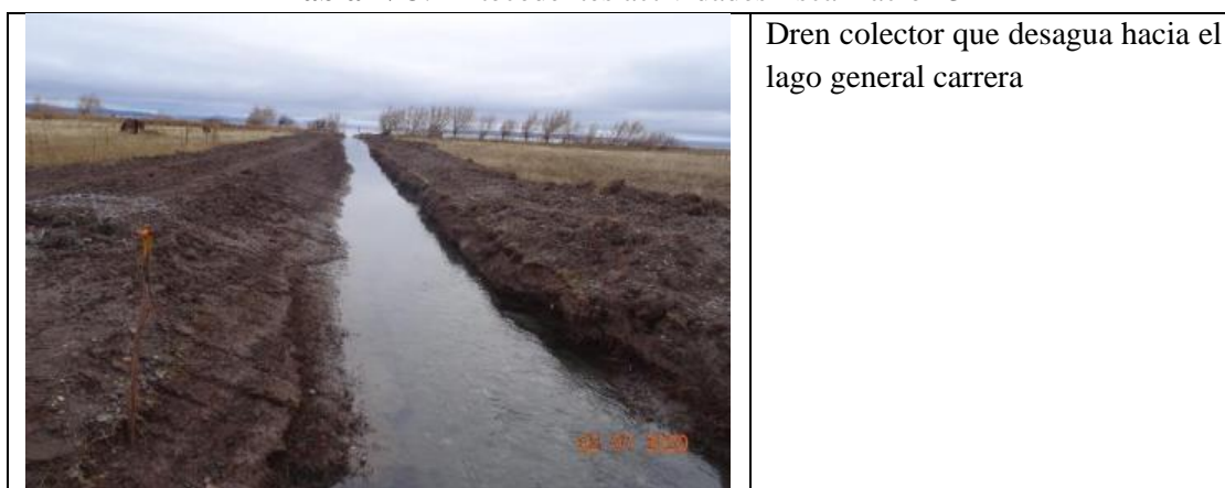
Tabla N°3: Antecedentes actividades fiscalización 3