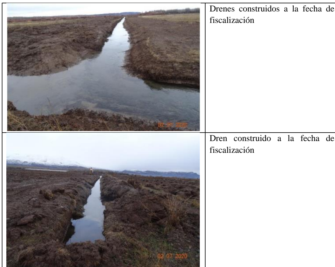
Tabla N°2: Antecedentes actividades fiscalización 2