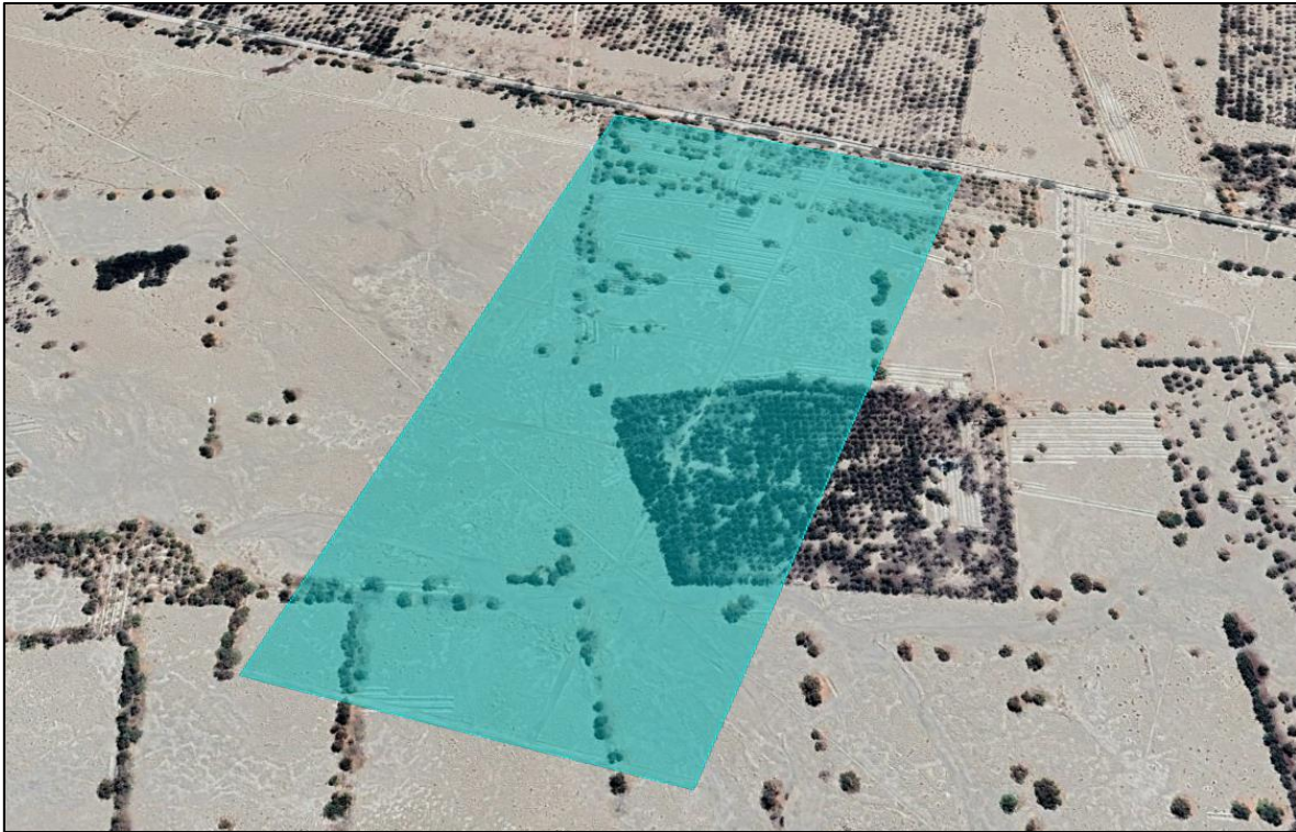
Figura N°1: Polígono proyecto “Habilitación de Subdivisión Predial”