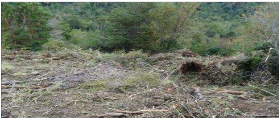
Fotografía N° 3: Árboles removidos por maquinarias pesadas.