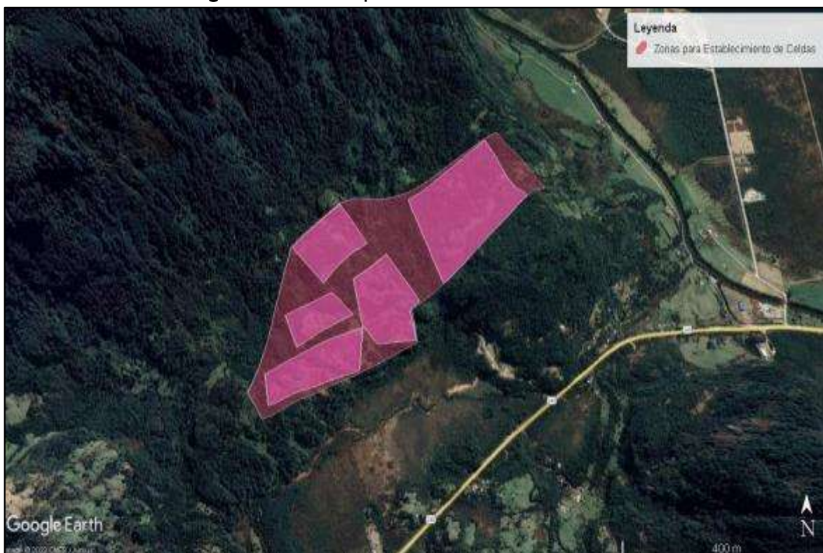
Figura N° 2: Zona para establecimiento de celdas.