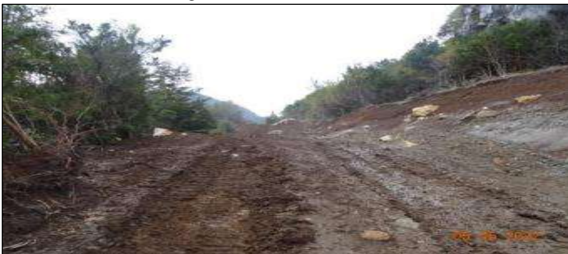
Fotografía N° 2: Camino en construcción.