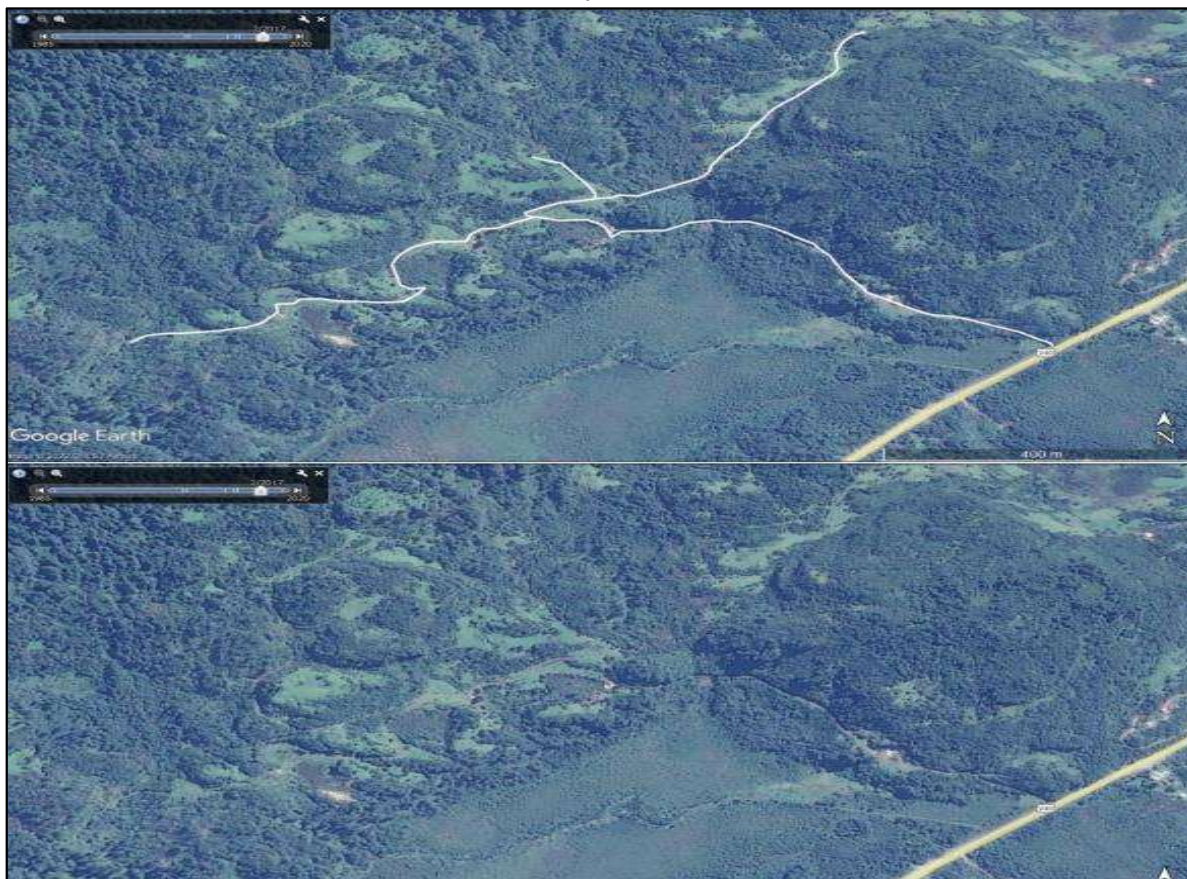
Figura N° 3: Superposición caminos existentes y recuperados lugar de emplazamiento del Proyecto.