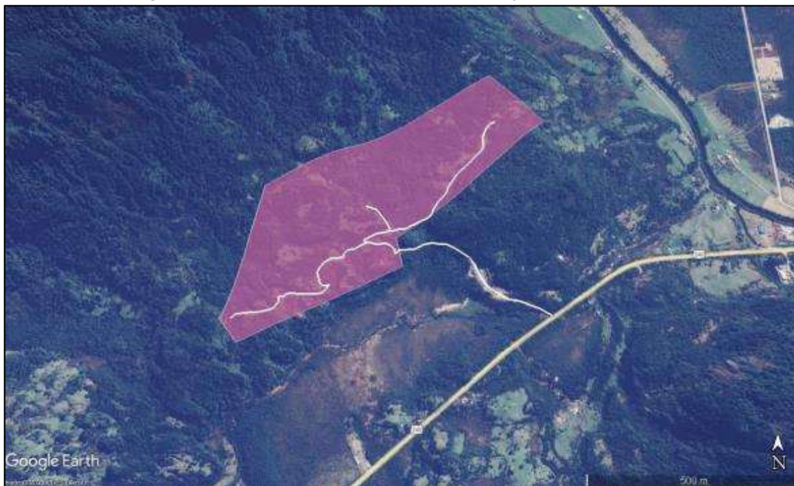
Figura N° 3: Caminos existentes con trabajos de recuperación.