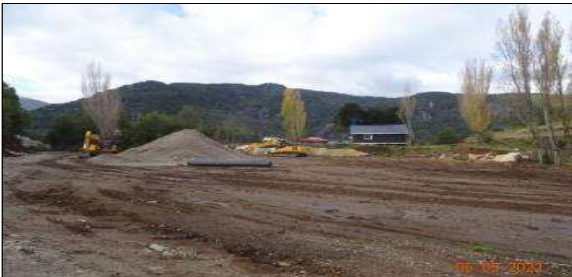
Fotografía N° 1: Casa de cuidador y extensión de terreno rellenada.