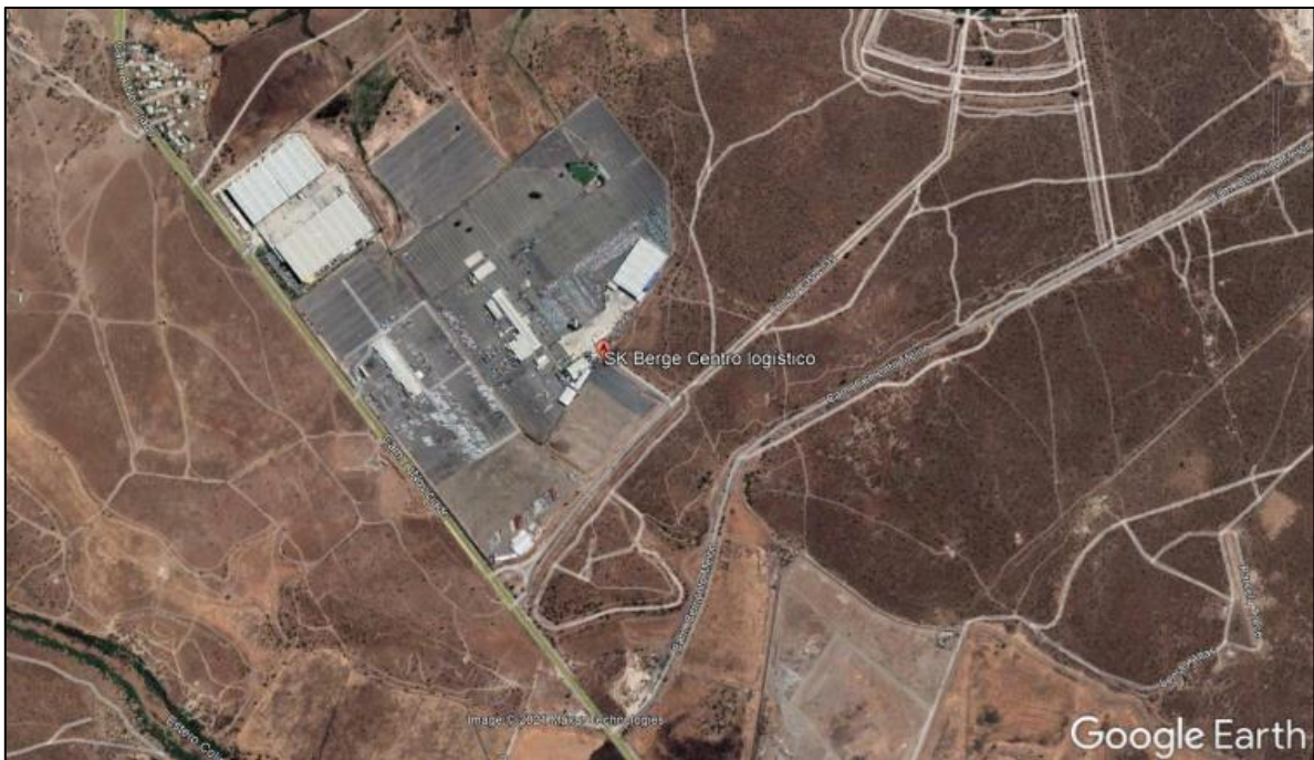
Imagen N°1: Ubicación del Proyecto