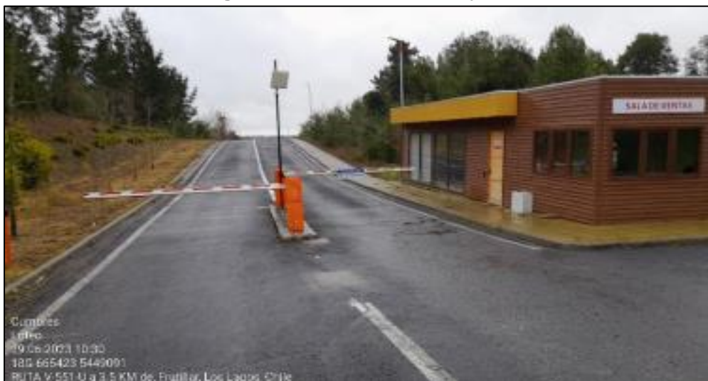
Imagen N° 2: Acceso del Proyecto