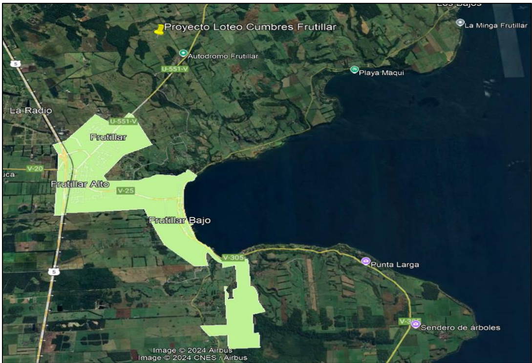
Imagen N° 7: Ubicación del proyecto “Loteo Cumbres de Frutillar”, con respecto al área urbana definida en el PRC de Frutillar.