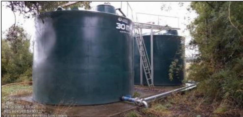
Imagen N° 5: Estanques de agua potable etapa 1 del Proyecto