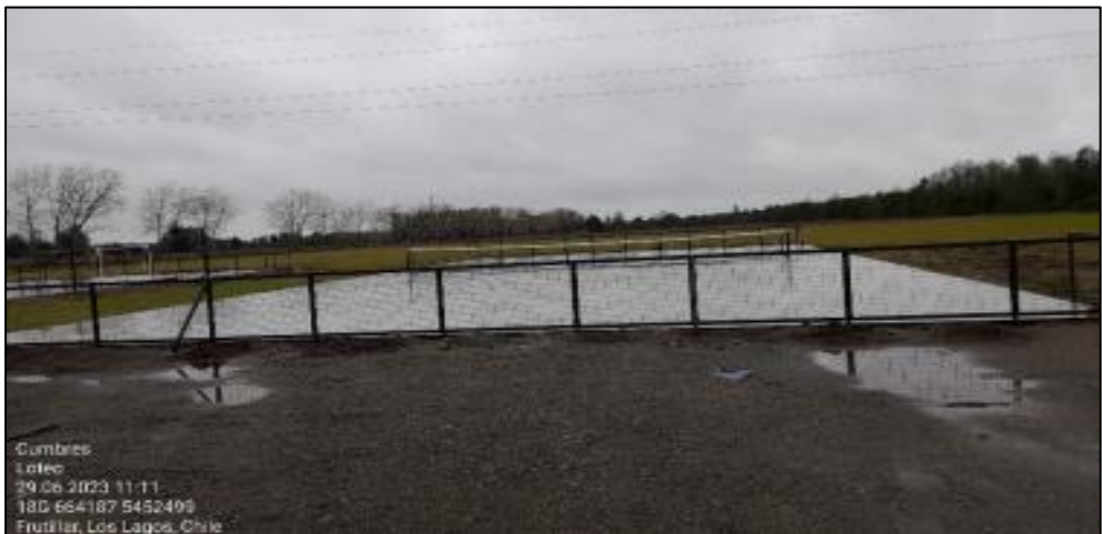
Imagen N° 4: Cancha de Tenis