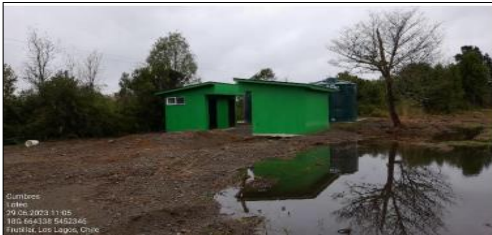
Imagen N° 6: Sala de agua potable asociada a la etapa 2 del Proyecto