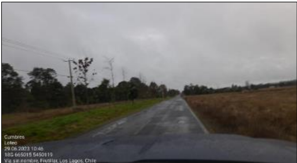
Imagen N° 3: Camino Asfaltado del Proyecto