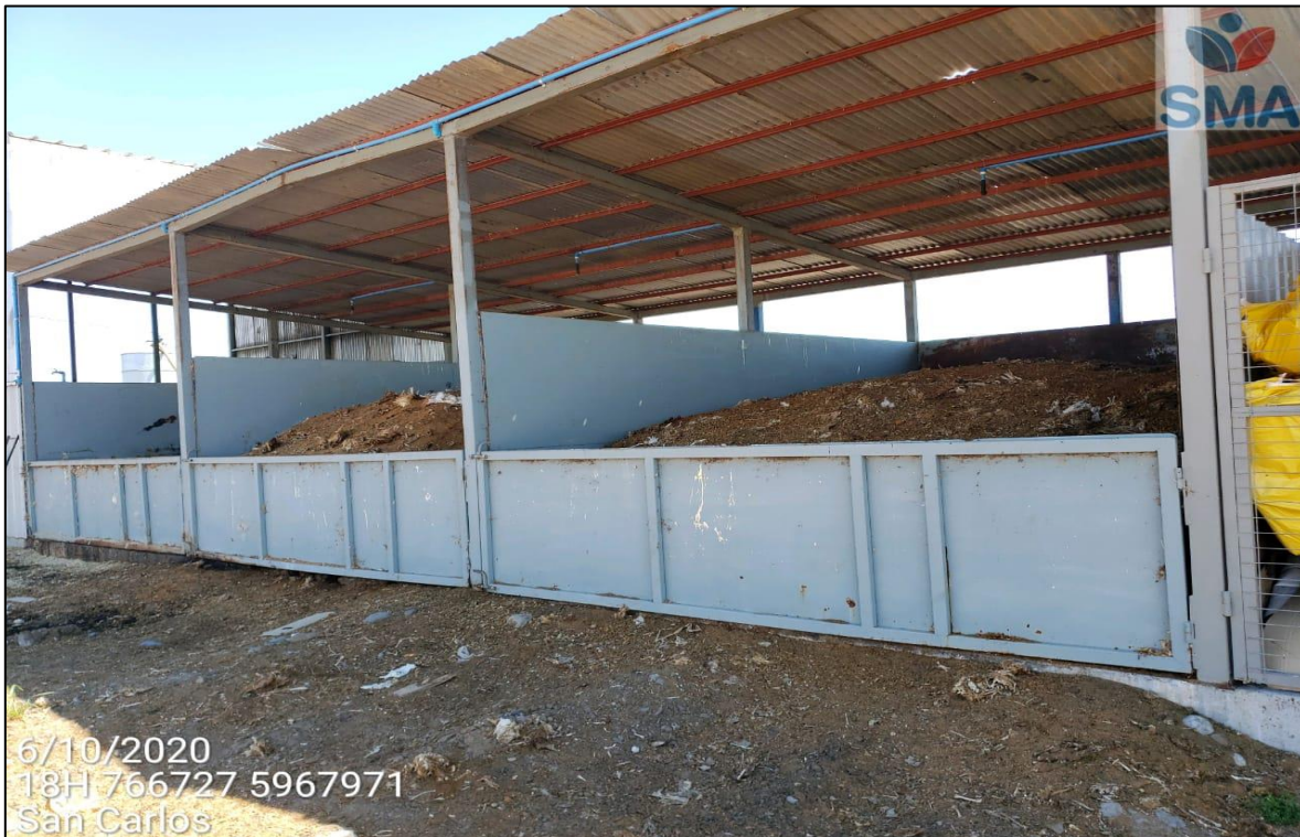
Imagen N° 3: Sala de compostaje de mortalidad del proyecto “Plantel Avícola El Porvenir”.