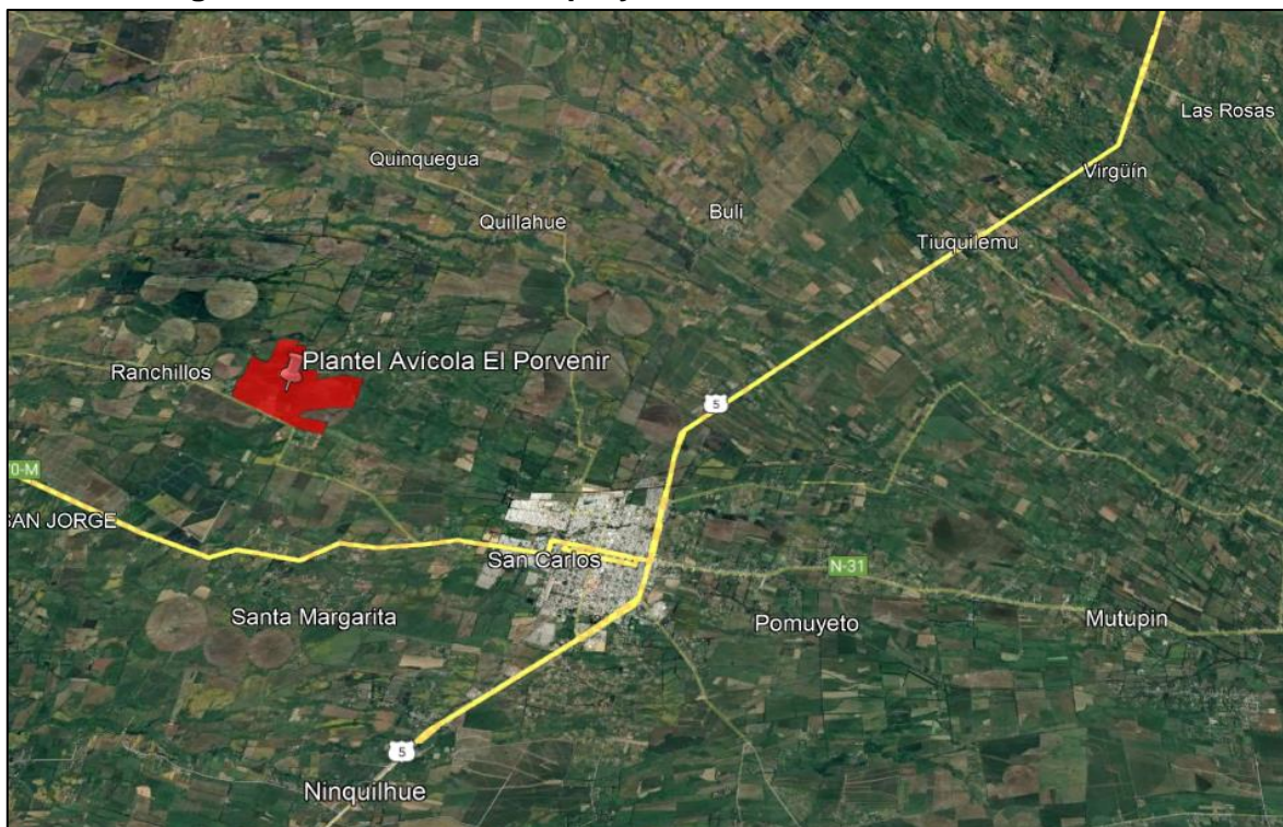
Figura N° 1: Ubicación del proyecto “Plantel Avícola El Porvenir”