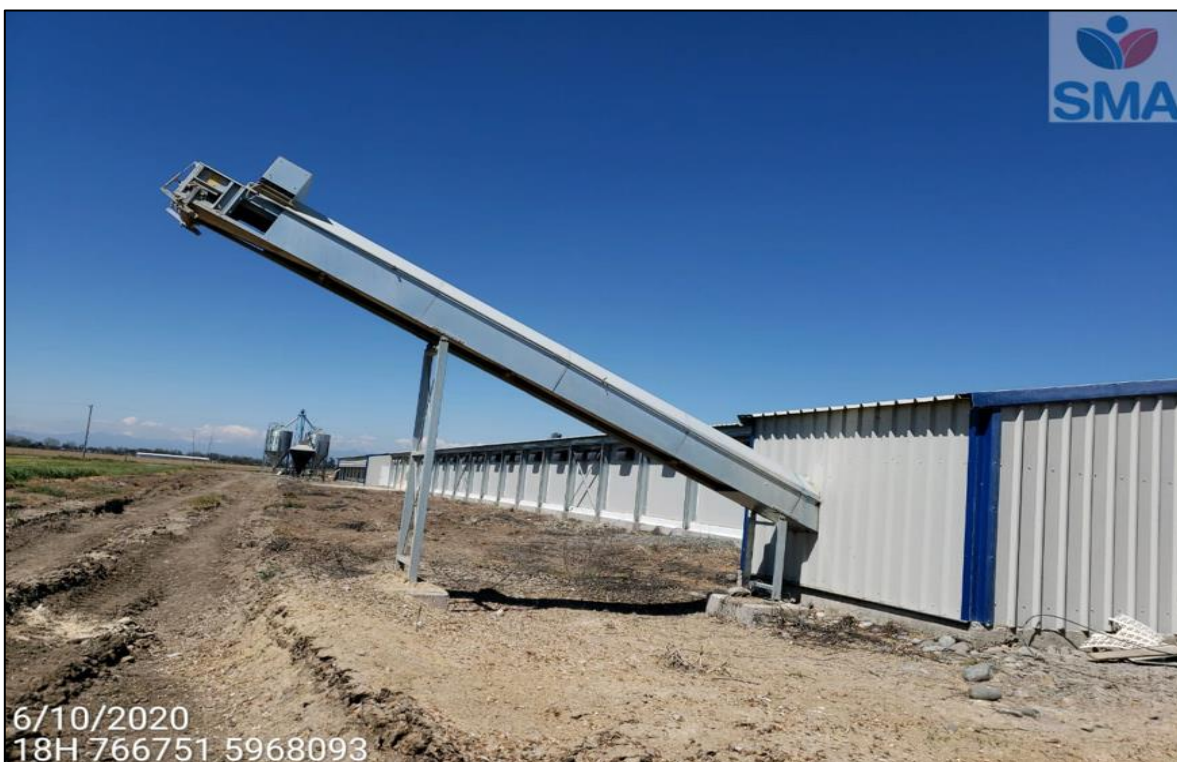
Imagen N° 1: Exterior del pabellón de postura del proyecto “Plantel Avícola El Porvenir”.