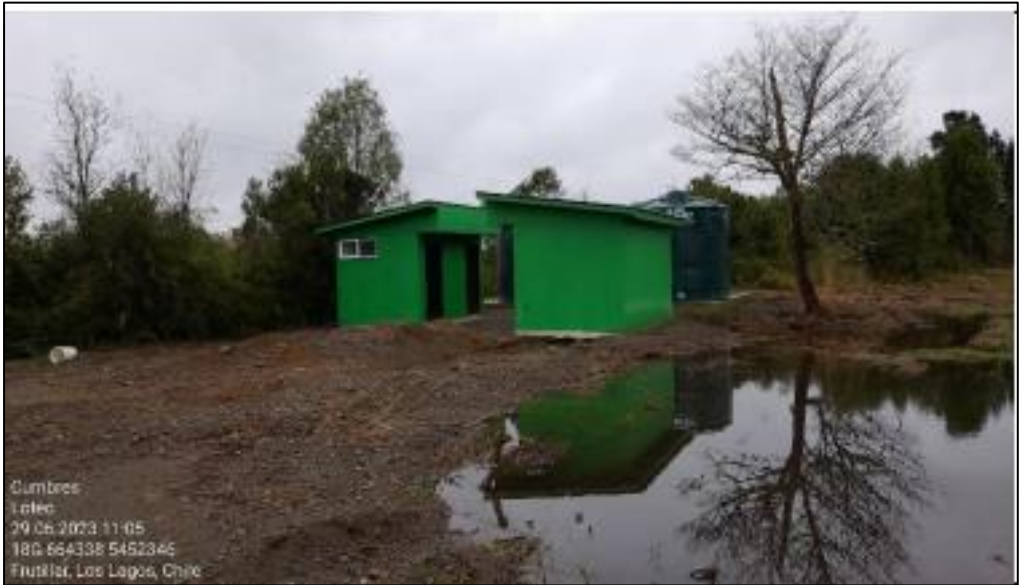
Imagen N° 5: Sala de agua potable asociada a la etapa 2 del Proyecto