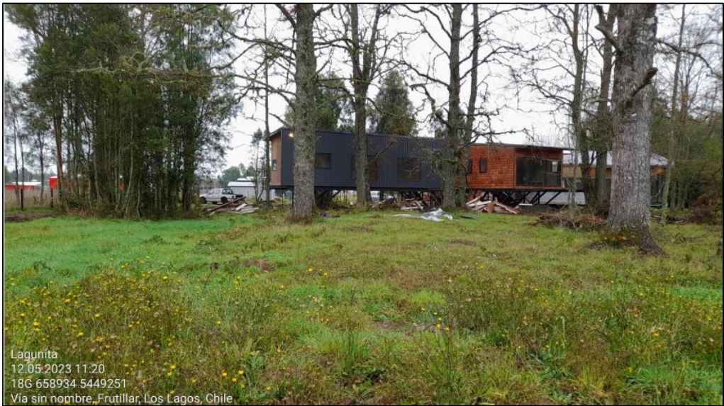
Imagen N° 4: Casa construida al interior del Proyecto