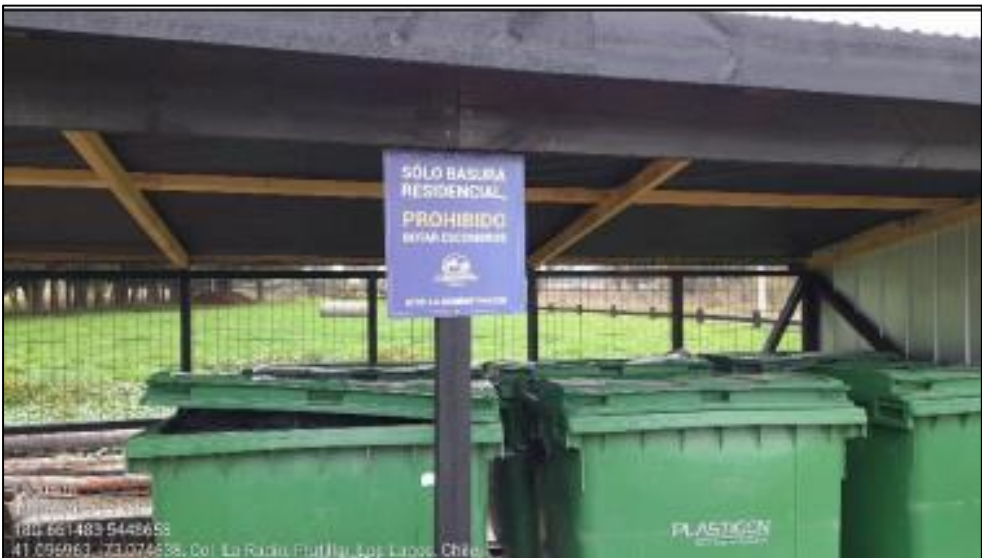
Imagen N° 3: Sector de disposición de residuos