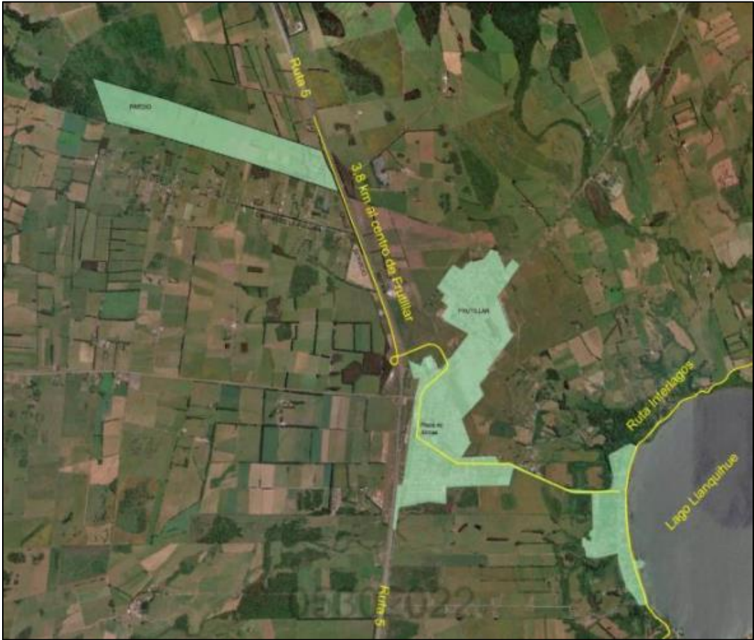
Figura N° 1: Ubicación del proyecto “Loteo Lagunita Frutillar”