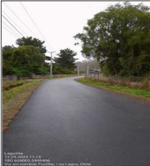
Imagen N° 1: Camino asfaltado del Proyecto