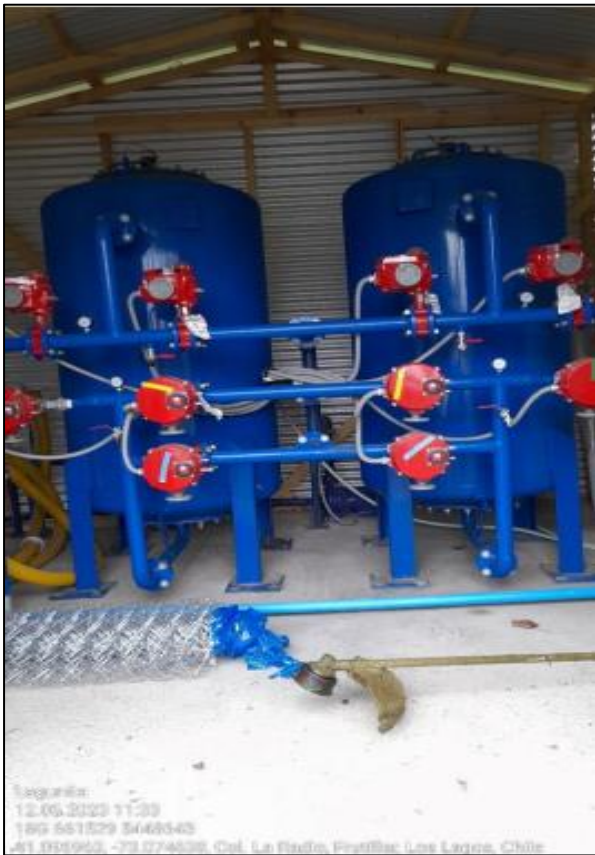
Imagen N° 2: Bombas del Proyecto