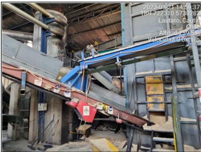
Imagen N° 2: Interior sala de calderas Lote A-1