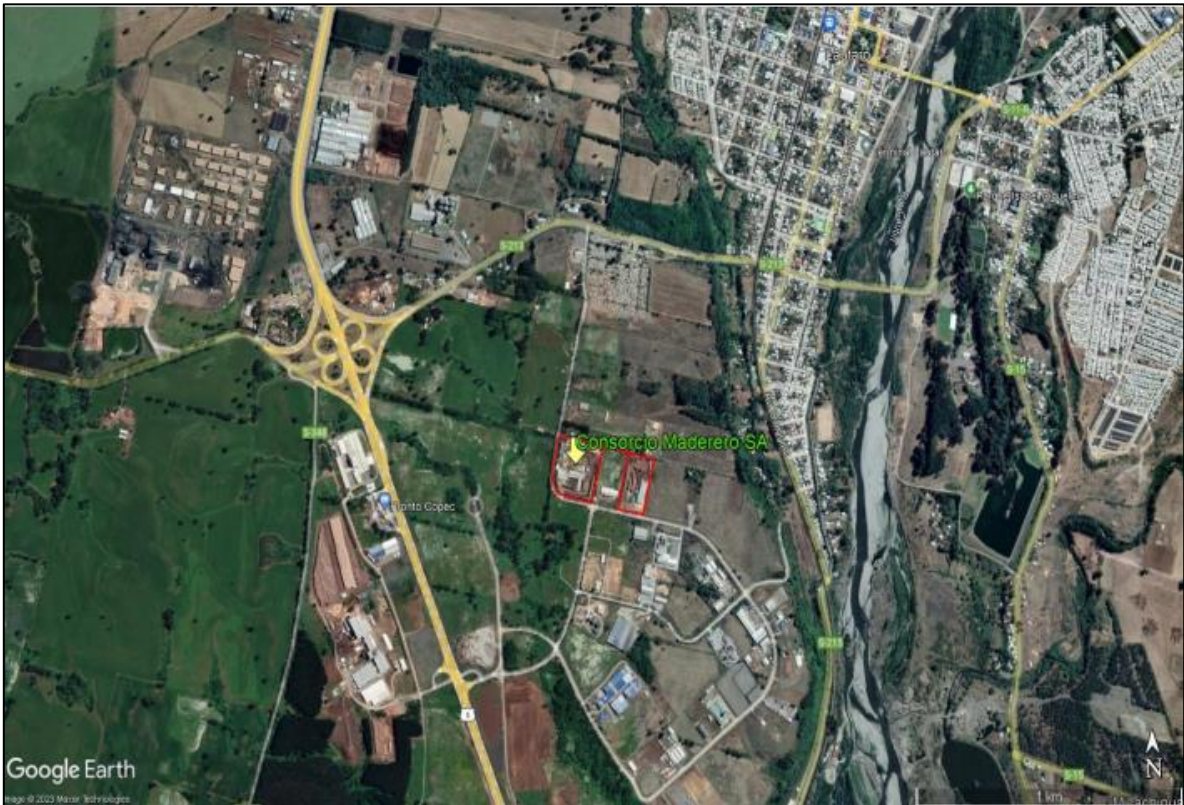
Figura N° 1: Ubicación del proyecto