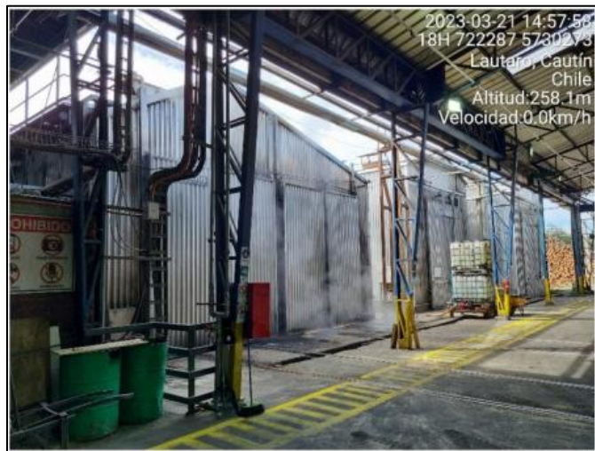
Imagen N° 1: Cámaras de Secado