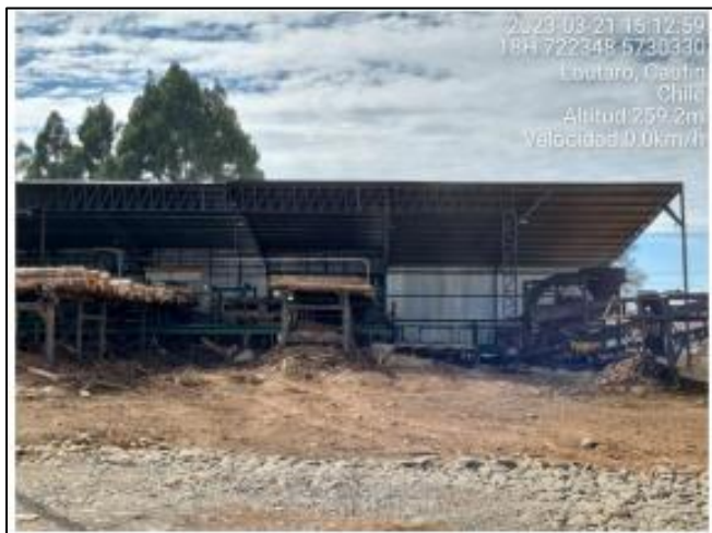
Imagen N° 3: Descortezador Aserradero E Lote A-1