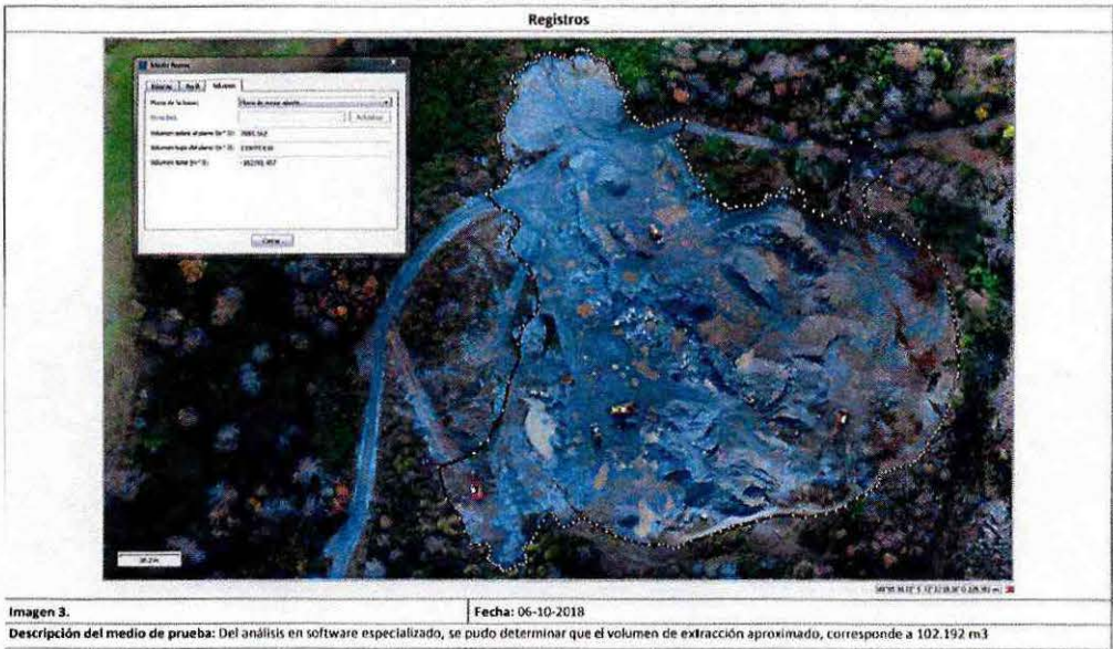
Figura N° 4. Determinación del volumen de extracción del área N° 1.