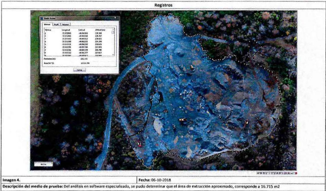
Figura N°3. Determinación del área de extracción N° 1.