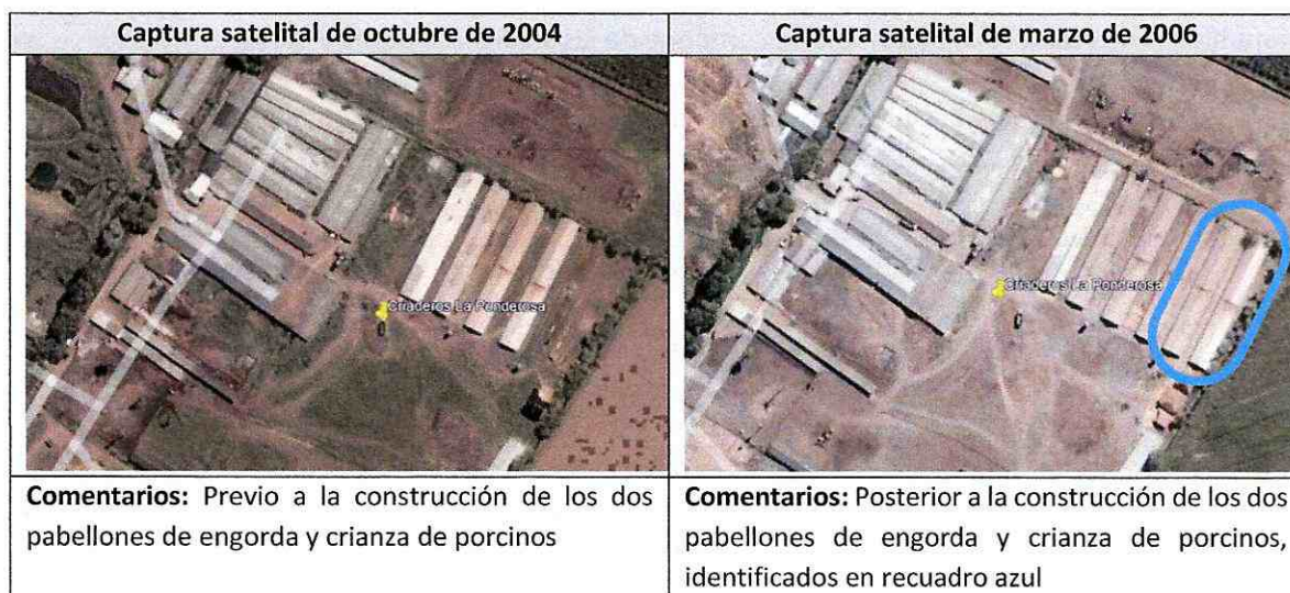
Figura 1. Contraste de imágenes satelitales de los años 2004 y 2006