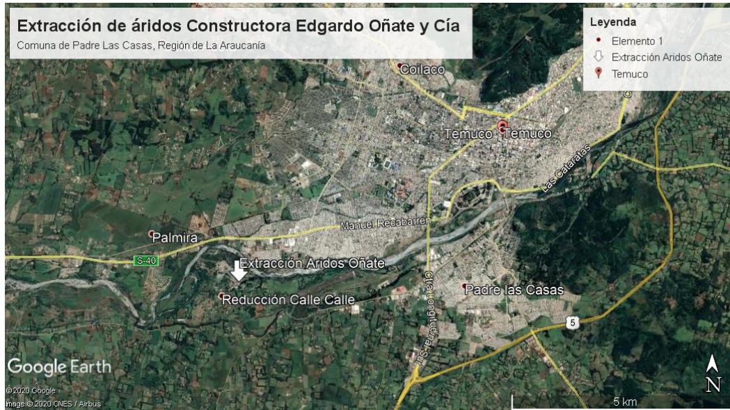
Figura 1. Mapa de ubicación local, Áridos Oñate, Padre Las Casas.

Coordenadas UTM de referencia: DATUM WGS 84 Huso: 18S UTM N: 5.706.561 m UTM E: 703.544 m