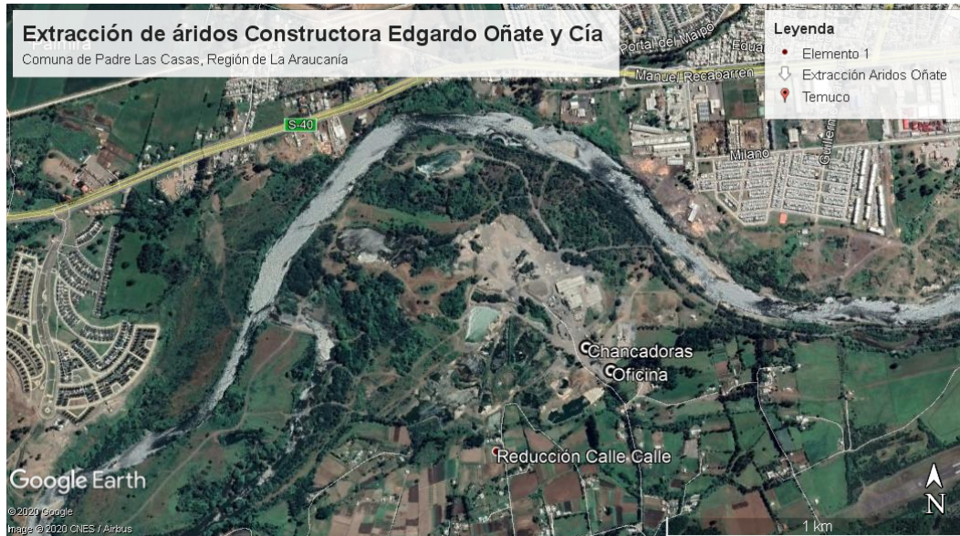
Figura 2. Estaciones visitadas en inspección de la SMA del día 09 de septiembre del 2020 (Fuente: Google Earth, 2020).