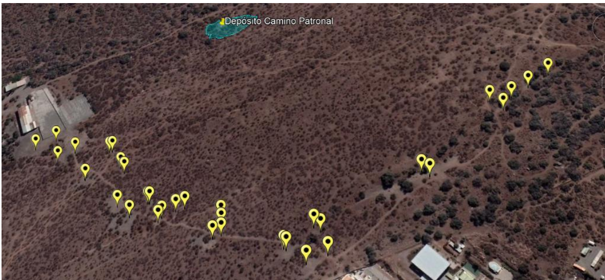
(Imagen N° 1. En amarillo, puntos de acopio de arenas contempladas en reportes de cumplimiento y actas de la SMA, en azul, ubicación del punto de acopio “Camino Patronal”).

En razón de la situación descrita, el punto de acopio “Camino Patronal” no fue considerado para aprobar el cumplimiento del Plan de Retiro de Arenas y, en la práctica, todavía alberga restos relacionados a la actividad de Algina.