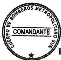
LEONARDO MARCHANT RIVEROS Comandante Cuerpo de Bomberos Metropolitano Sur