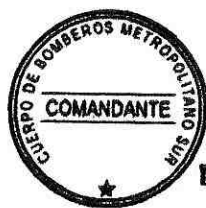
LEONARDO MARCHANT RIVEROS Comandante Cuerpo de Bomberos Metropolitano Sur