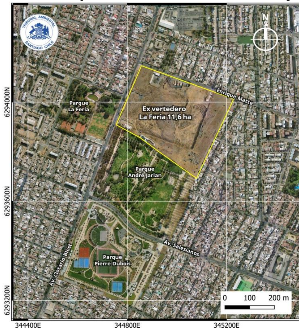
Figura N° 1: Cartografía de contexto territorial del proyecto

Fuente: Elaboración propia, generada en QGIS 3.16 con antecedentes disponibles en el expediente de la causa más Google Earth. Sistema de Referencia de Coordenadas WGS84 UTM Zona 19 Sur (EPSG:32719).