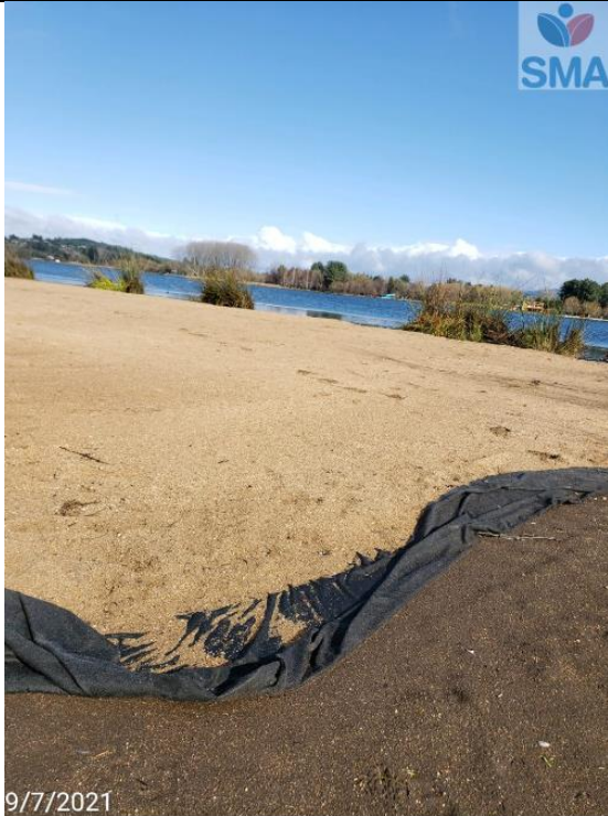
Foto N° 7 Relleno humedal urbano sector norte para habilitación de playa artificial (bajada 1) con arenas externas (café) y geotextil inferior.