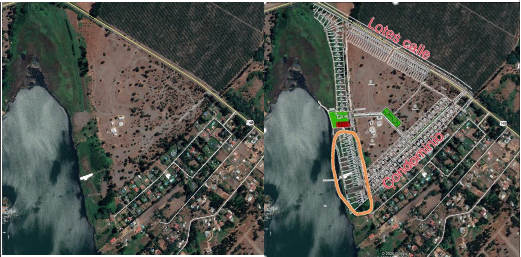
Figura 2. Layout sin proyecto / con proyecto