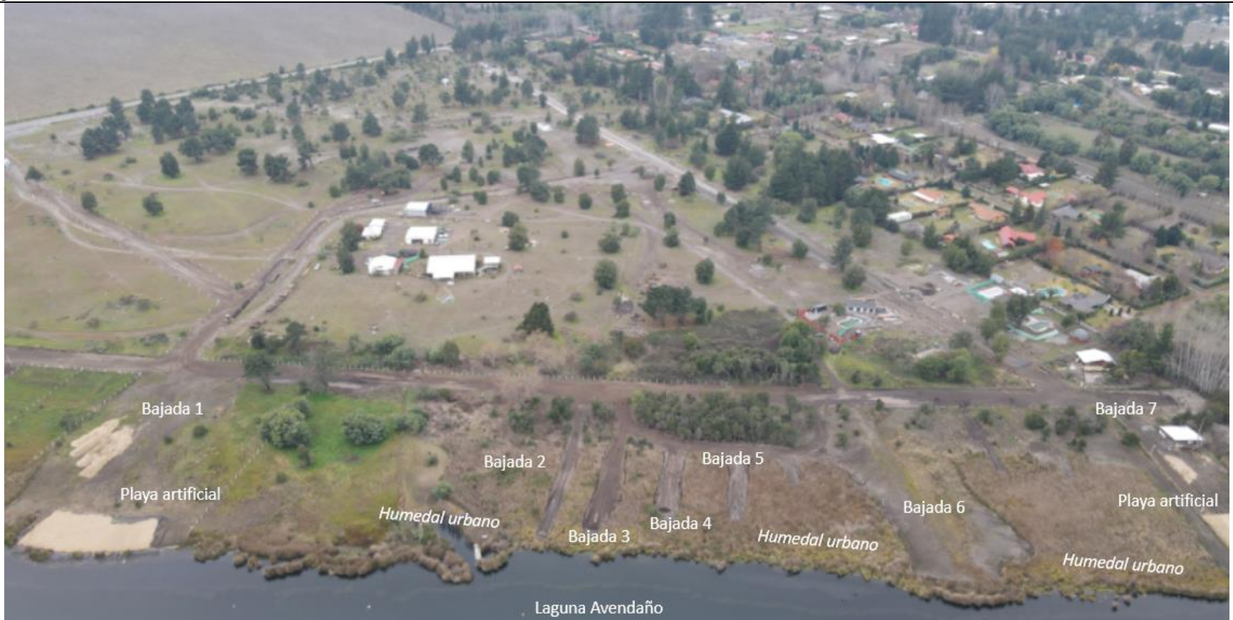
Imagen N° 1 Análisis vuelo Dron 08.07.2021

Dada la publicación de la Ley 21.202, que Modifica Diversos Cuerpos Legales con el Objetivo de Proteger los Humedales Urbanos, como también la Publicación del D.O. de fecha 01 de julio de 2021 la zona intervenida se emplaza en un humedal urbano en proceso de declaración y reconocimiento como “humedal urbano” por el Ministerio de Medio Ambiente, a petición de la I. Municipalidad de Quillón. Atendido lo anterior es que resulta aplicable esta causal de ingreso al SEIA, toda vez que los objetos de protección analizados son sujetos de intervención y eliminación como dan cuenta las imágenes drone N1, N2, N3 y N4 en una superficie estimada de 1.005 m 2 .