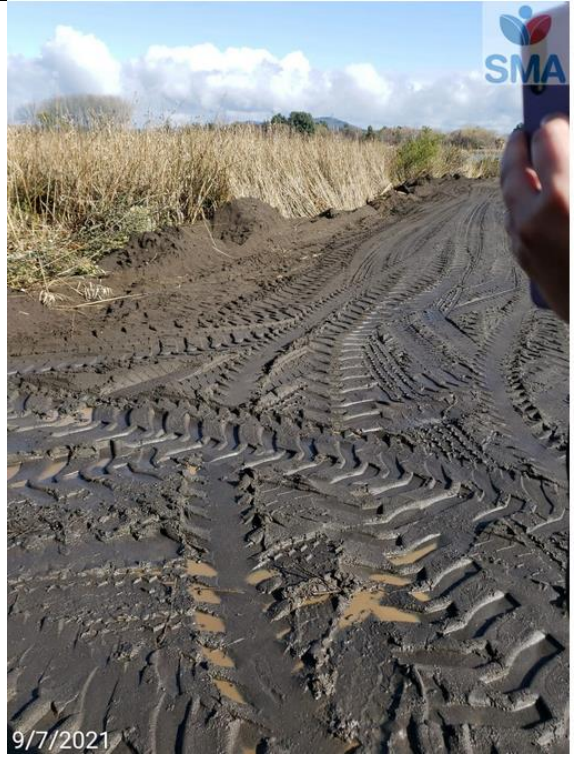
Foto N° 12 relleno para nuevo acceso laguna sobre humedal urbano (bajada 4), foto da cuenta de movimiento reciente de maquinaria y camión.