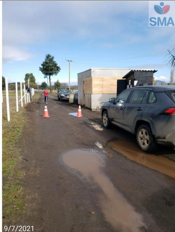
Foto N° 1 Sector acceso loteo y obstrucción de ingreso Sr. Joshua Pajuelo – Portero cuidador - Rut: Rechaza informar.