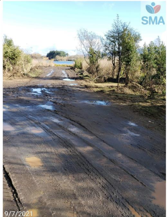
Foto N° 11 relleno para nuevo acceso laguna sobre humedal urbano (bajada 3)