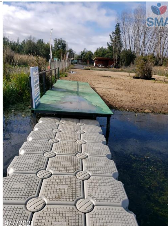
Foto N° 14 relleno para nuevo acceso laguna sobre humedal urbano con presencia de muelle flotante (bajada 7) – también existe aplicación de arenas externas de color café.