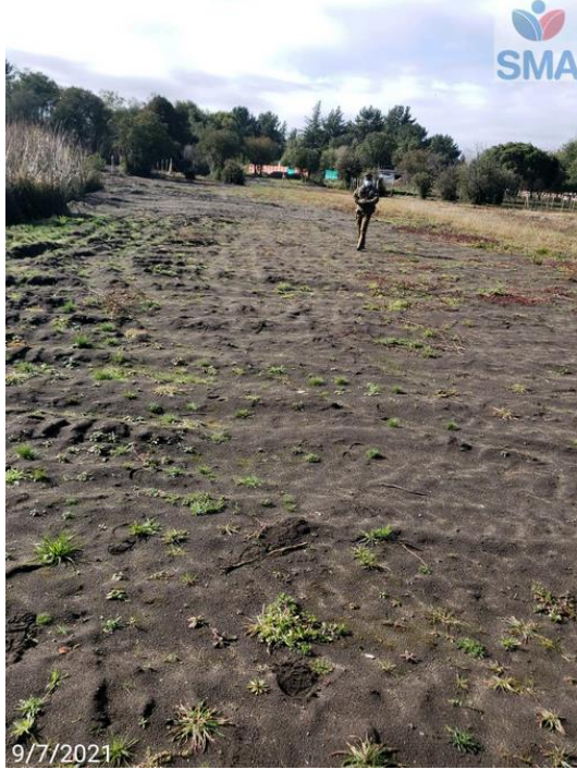
Foto N° 5 Inicio fiscalización con resguardo policial en bajada playa artificial de humedal urbano (bajada 1).