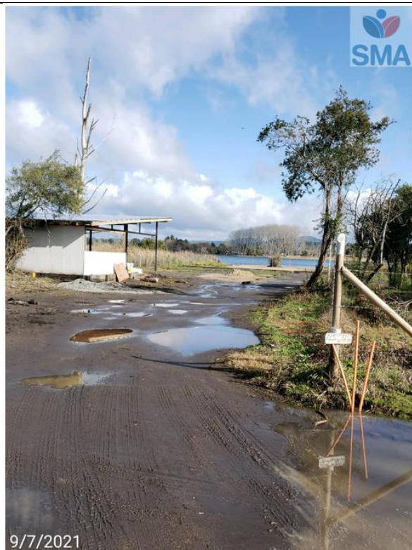
Foto N° 13 relleno para nuevo acceso laguna sobre humedal urbano equipamiento (bajada 7), presencia de arenas externas (color café).