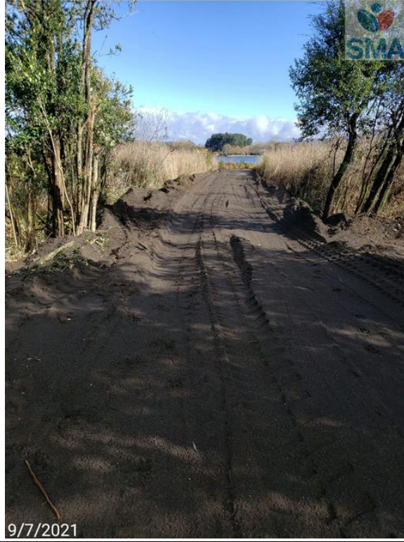
Foto N° 10 relleno para nuevo acceso laguna sobre humedal urbano (bajada 2)