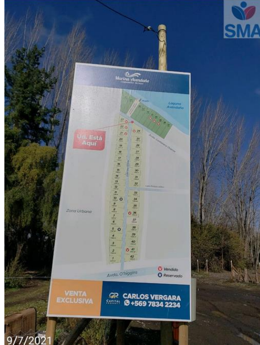
Foto N° 6 plano de loteo identificando venta de 03 lotes de borde laguna (color verde).