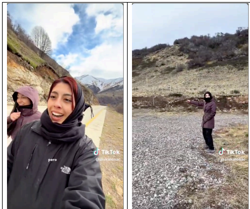
Imagen No.1: Turistas graban videos informando sobre el Centro de rescate y rehabilitación caminando a orillas de la ruta 7 (izquierda) y rodeando los corrales destinados a mantener en cautiverio a los posibles huemules que ingresen al Centro (derecha).

construcciones del centro, generan un aumento del riesgo de accidentes vehiculares por los autos que estacionan en lugares no habilitados, y por los peatones que caminan por la berma angosta hacia la entrada de las dependencias del centro.