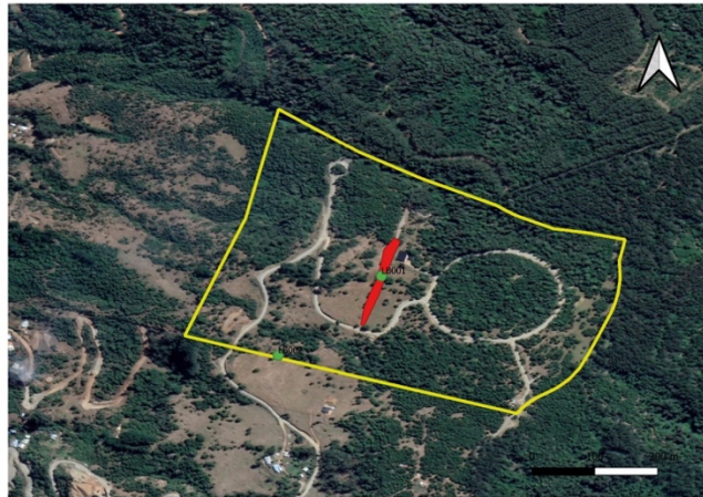
Figura 1. Localización de los hallazgos identificados en terreno.

A continuación, se entrega una figura representativa de la localización de los hallazgos mencionados.