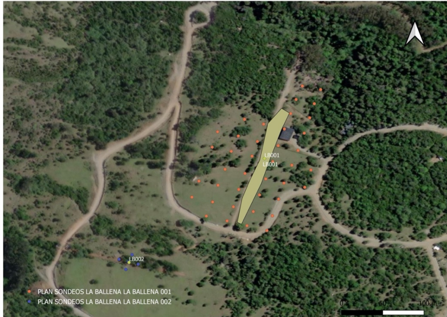
Figura 3. Plan de Sondeo.

Al respecto, conforme se aprecia en la figura siguiente, se propone un grilla de 40 pozos para el sitio LB001 y de 5 pozos para el hallazgo LB002. Se considera una distancia de 25 metros entre cada uno de los pozos definidos.