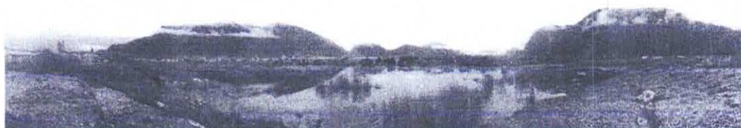
Vista borde costero Ribera Norte hacia sector Aguas Muertas, en período de alta marea y sin lluvia. Al fondo a la derecha se observa el Cerro Marchant.