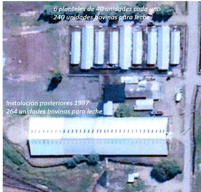
Imagen N°1: Planteles y unidades de animales Fundo Los Tilos

de 264 unidades de animales, considerados como de vaca lechera, tal como se expresa en la siguiente imagen: