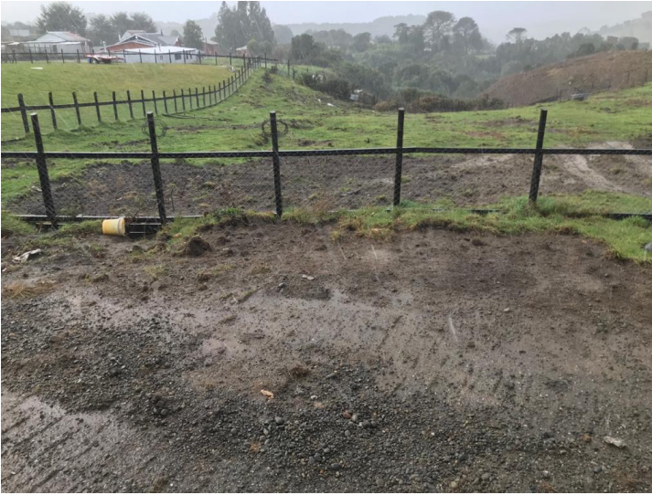
Imagen 3. Zona de drenes inhabilitada.