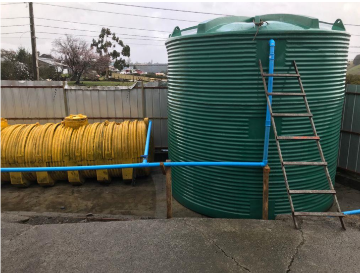
Imagen 4. Sistema de acopio de RILes, estanque 30 m 3 .