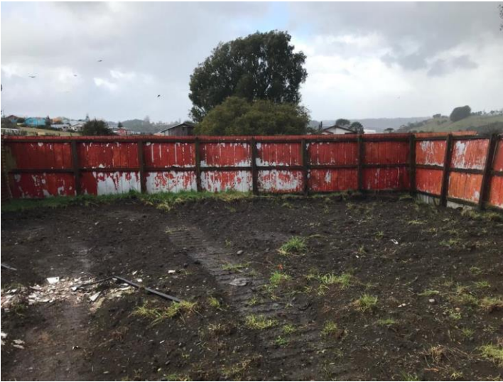
Imagen 1. Cierre sistema de infiltración.