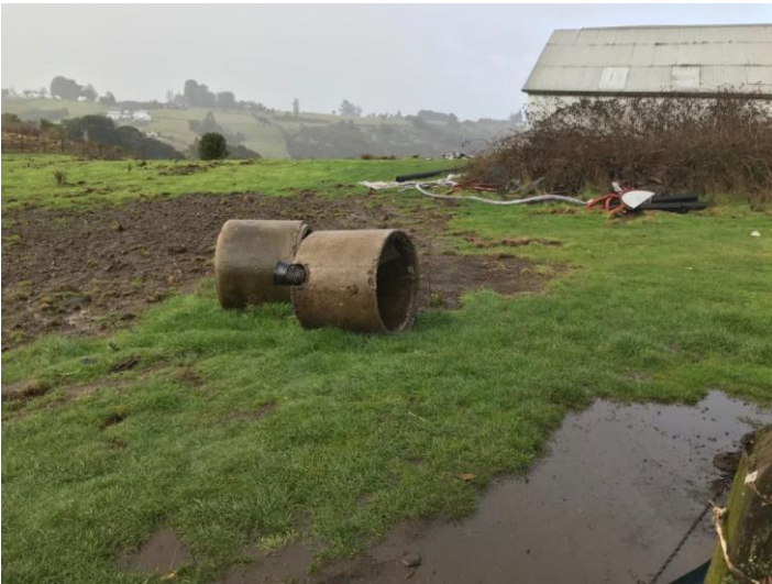
Imagen 2. Zona de drenes inhabilitada.