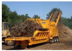
Máquina trituradora móvil