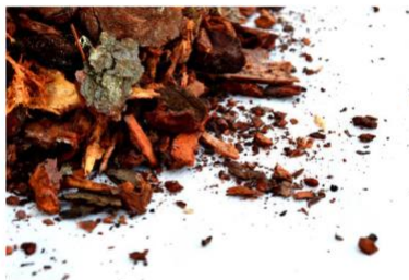
Compra de corteza