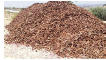
Producto final: corteza triturada