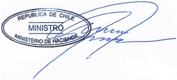
MARIO MARCEL CULLELL Ministro de Hacienda

ANÓTESE, TÓMESE RAZÓN Y COMUNÍQUESE POR ORDEN DEL PRESIDENTE DE LA REPÚBLICA