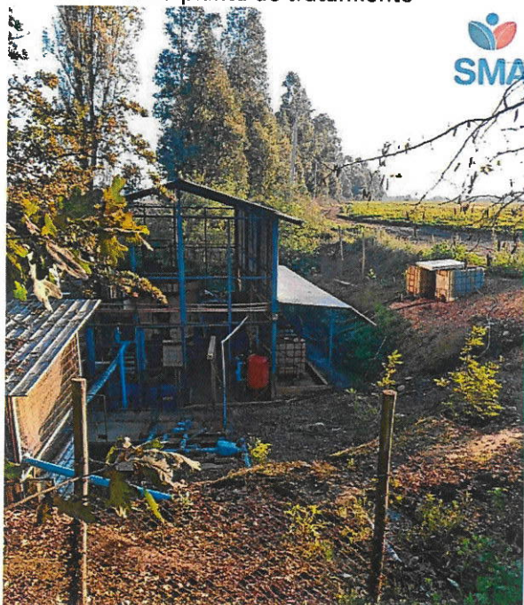
Vista planta de tratamiento