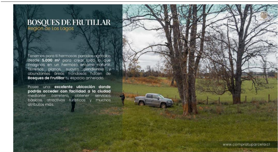
Imagen 1. Fecha: ---- Descripción del medio de prueba: Dirección https://www.compratuparcela.cl en la cual se promociona la unidad fiscalizable.