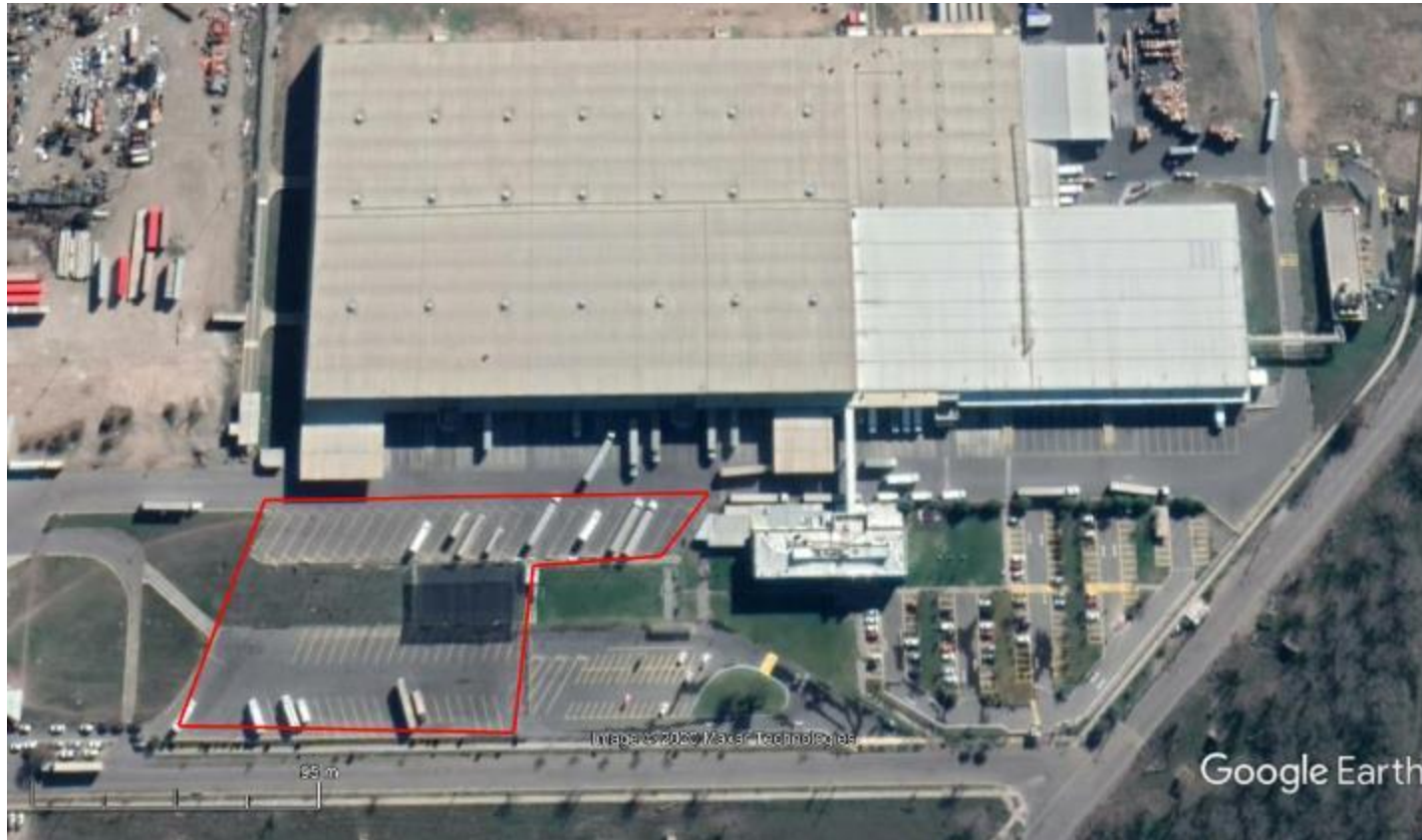
Figura 2 Fecha imagen: 07.02.2019

Descripción del medio de prueba: Vista aérea de los dos sitios de estacionamiento de camiones.