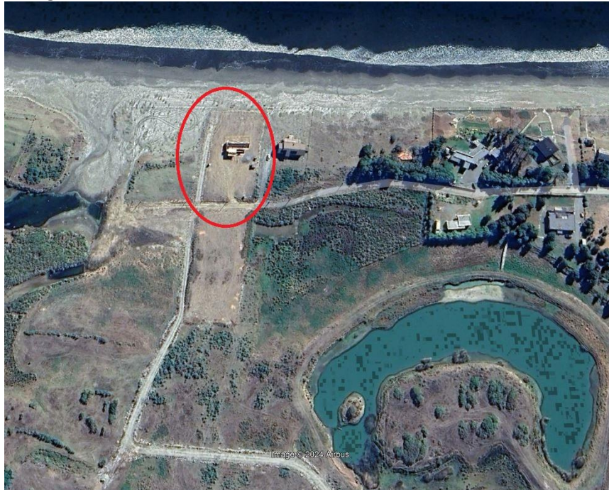
Imagen 1. Vivienda edificada en terreno rellenado en marzo de 2022

propietarios, los que han ido desarrollando obras de distinta índole en sus predios. En efecto, en sus presentaciones el titular ha señalado que las obras de modificación de humedal Curaquilla han sido obra de los nuevos propietarios de los loteos . Lo expuesto queda en evidencia en el acta de inspección ambiental de fecha 2 de marzo de 2023, en donde se constató la construcción de una nueva vivienda en el terreno que fue rellenado en marzo de 2022, producto de la modificación de la zanja artificial. Para ilustrar lo anterior se puede observar la siguiente imagen tomada a través de la plataforma Google Earth, del mes de abril de 2023: