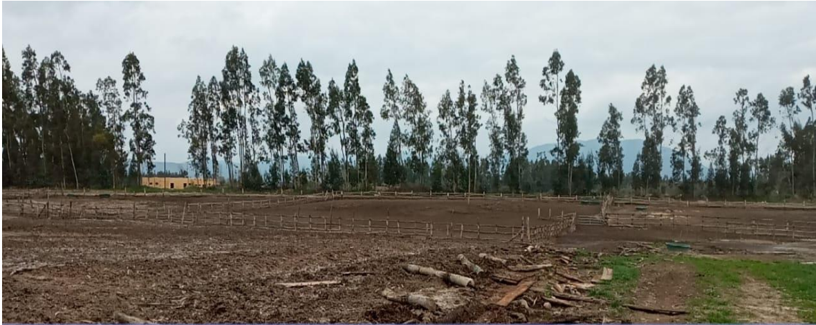
Ruta G60, Melipilla, Región Metropolitana, Chile Date:- 01-09-2020 Time:- 3:08 p. m.