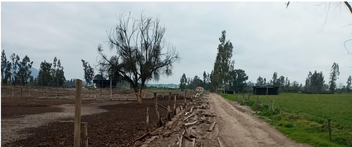
Ruta G60, Melipilla, Región Metropolitana, Chile Date:- 01-09-2020 Time:- 3:10 p. m.